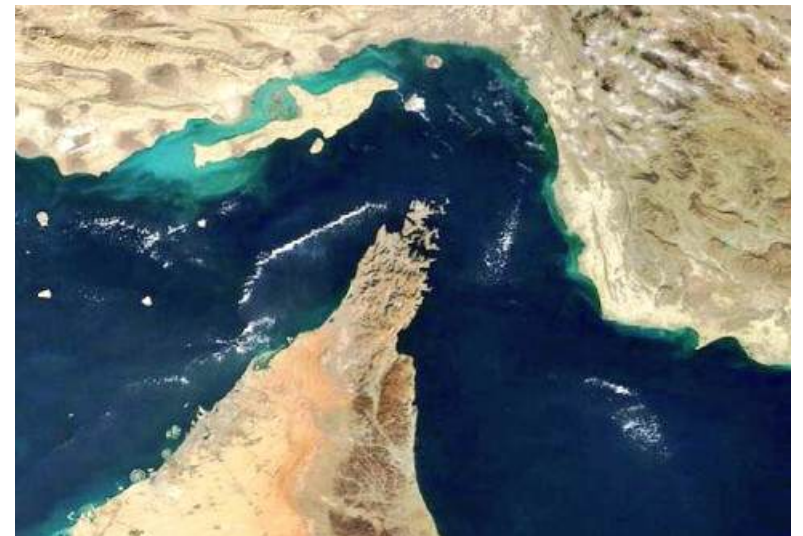
(మిగతా 2వ పేజీలో)

ప్రపంచ ఇంధన వాణిజ్యంలో అత్యంత కీలకమైన హార్నూజ్ జలసంధిలో ప్రయాణించే వాణిజ్య నౌకలపై సేవా రుసుములు వసూలు చేయనున్నట్లు ఇరాన్ ప్రకటించింది. అమెరికాతో కుదుర్చుకున్న 60 రోజుల ఉచిత ప్రయాణ ఒప్పందం ముగిసిన తర్వాత ఈ నిర్ణయం అమల్లోకి వస్తుందని స్పష్టం చేసింది. అయితే, కక్షకాలంలో తమకు మద్దతుగా నిలిచిన స్నేహపూర్వక దేశాలకు ప్రత్యేక రాయితీలు కల్పిస్తామని తెలిపింది. చైనాలోని ఇరాన్ రాయబారి అబ్దుల్‌రెజా రహమానీ ఘజ్జి శనివారం బీజింగ్‌లో జరిగిన పరల్వే పీస్ ఫోరంలో ఈ వివరాలు