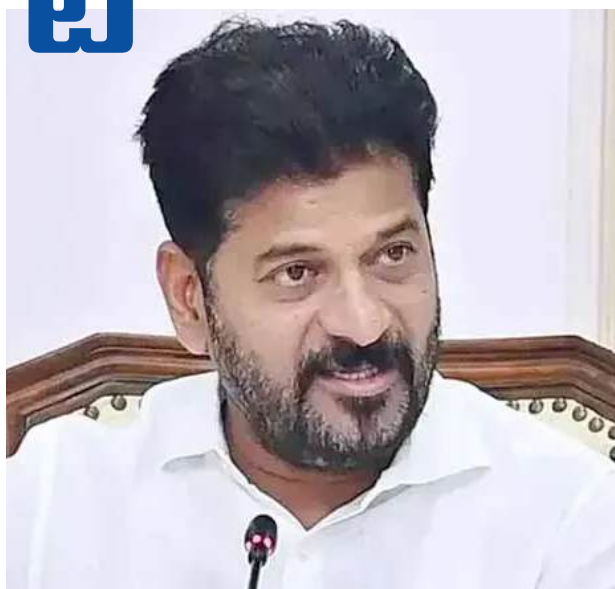
(మిగతా 2వ పేజీలో)