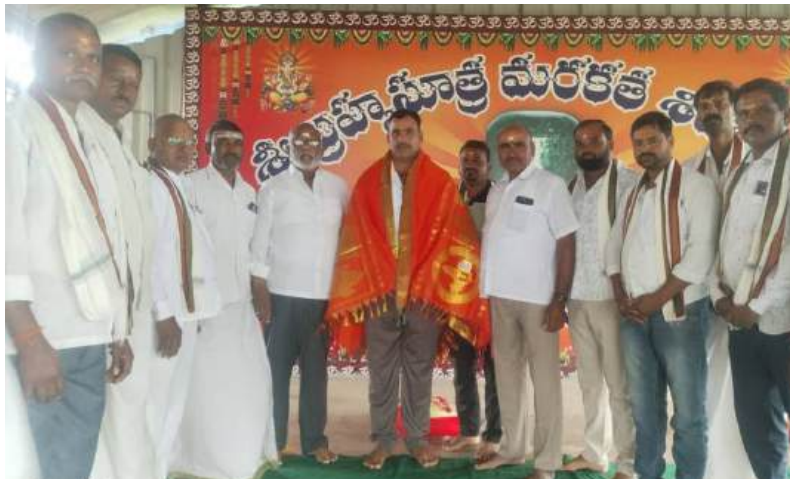
అభివృద్ధి చేస్తామని, భక్తులకు ఎలాంటి లోటు లేకుండా ప్రత్యేక ఏర్పాట్లు కల్పిస్తామని వారు చెప్పారు. కార్యక్రమంలో మాజీ చైర్మన్లు, మాజీ కమిటీ సభ్యులు ఉన్నారు.