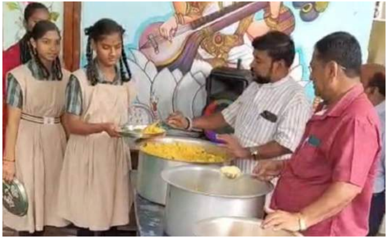
వార్త మిర్చర్ తెలంగాణ స్టేట్ బ్యూరో కృష్ణ గోపాల్ సేవా సమితి ఆధ్వర్యంలో అనాధ పాఠశాల విద్యార్థులకు ఉదయం అల్పాహార