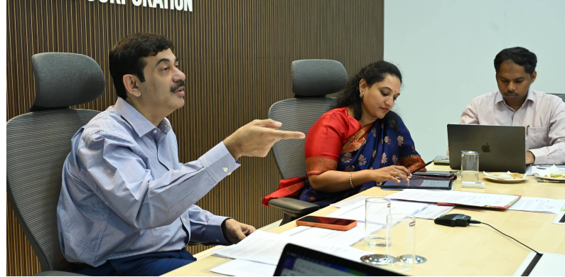
కమిషనర్, సంబంధిత శాఖలు మరియు ఏజెన్సీలు సమన్వయంతో పనిచేసి అన్ని సమస్యలను సకాలంలో పరిష్కరించాలని అధికారులను ఆదేశించారు.

మయూఫార్ వార్త మిర్చర్ : వన్ వార్డ్ ఎవర్ డే కార్యక్రమంలో భాగంగా సైబరాబాద్ మున్సిపల్ కార్పొరేషన్ కమిషనర్, ఎమ్మెల్యే త్రి అరికేపూడి గాంధీ, జోనల్ కమిషనర్, డిప్యూటీ కమిషనర్ మరియు ఇతర అధికారులతో కలిసి కూకట్ పల్లి జోన్ లోని మాధాపూర్ సర్కిల్ పరిధిలోని మయూరి నగర్ ను సందర్శించి స్థానిక నివాసీతులు, కాలనీ ప్రతినిధులతో సమావేశమై పౌర సమస్యలు మరియు మౌలిక వసతుల అవసరాలపై సమీక్ష నిర్వహించారు. సమావేశంలో సర్వే నెం.172 వద్ద ఆస్తుల స్వాధీనం అనంతరం రోడ్డు విస్తరణ, ఇరుకైన రోడ్ల వద్ద హాస్పిటల్ బోర్డుల ఏర్పాటు, కొత్త హాస్పిటల్ భవనాలకు అనుమతుల నియంత్రణ, వీధి కుక్కల నియంత్రణ చర్యలు, సీఆర్టీఎఫ్ పరిసరాలలో నీటి నిల్వ ప్రాంతాల్లో దోపిడీ నివారణ (స్క్వాయింగ్) వంటి అంశాలను సమీక్షించారు. అదేవిధంగా సుభాష్ చంద్రబోస్ నగర్ లో కేబుల్స్, పాడి చెత్త దహనాన్ని అరికట్టడం, మయూరి నగర్ వార్డు ట్యాంక్ సమీపంలో ఉన్న సీసీ, బీటీ శిథిలాల తొలగింపు, అలాగే మయూఫార్--గండ్లపేట రోడ్డు మరియు డ్రెయిన్ వసతుల అవసరమైన నిధులతో సహా హెచ్ఎంఏఏ నుంచి కార్పొరేషన్ కు అప్పగించే అంశంపై ప్రతిపాదన వంపాలని సంబంధిత అధికారులతో కమిషనర్ సూచించారు. స్థానికులు తెలిపిన సమస్యలు, సూచనలను క్షేత్రస్థాయిలో పరిశీలించిన