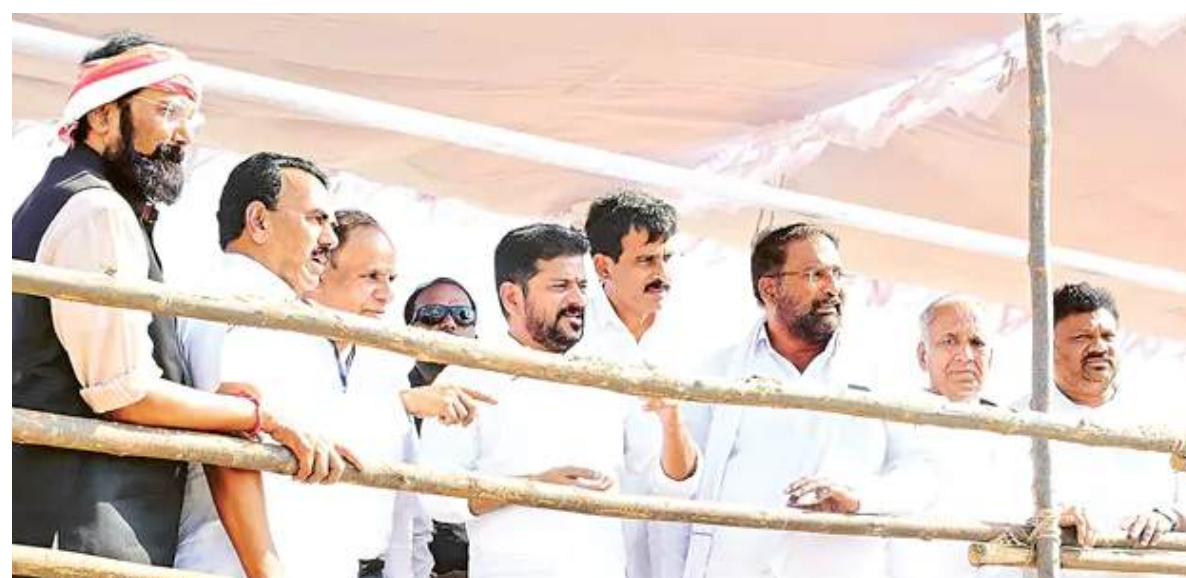
హైదరాబాద్: పాలమూరు-రంగారెడ్డి ప్రాజెక్టు పెండింగ్ పనులను యుద్ధప్రాతిపదికన పూర్తిచేయాలని ముఖ్యమంత్రి రేవంత్‌రెడ్డి అధికారులను ఆదేశించారు. ఎట్టి పరిస్థితుల్లోనూ 6 నెలల్లో కర్వెస్ రిజర్వాయర్ వరకు నీరందించాలని చెప్పారు. దీంతోపాటు ఉమ్మడి మహబూబ్‌నగర్ జిల్లాలోని ఇతర సాగునీటి ప్రాజెక్టుల నిర్మాణానికి అవసరమైన భూసేకరణను సత్వరంగా పూర్తి చేసేందుకు అత్యంత

భూసేకరణ, పునరావాసానికే తొలుత నిధుల కేటాయింపు యుద్ధప్రాతిపదికన భూసేకరణ పూర్తి చేయాల్సిన బాధ్యత కలెక్టర్లదే.. ప్రాజెక్టులకు నిధుల కొరత లేకుండా చూసుకుంటాం.. మంత్రులు.. ఎమ్మెల్యేలు, ఎమ్మెల్యీలు, అధికారులతో సమన్వయం చేసుకోవాలి.. ఉమ్మడి మహబూబ్‌నగర్ జిల్లాలోని ప్రాజెక్టుల పురోగతిపై సీఎం ఉన్నతస్థాయి సమీక్ష