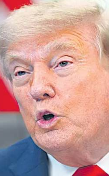
(మిగతా 2వ పేజీలో)

పేర్కొన్న సంగతి తెలిసిందే. ఇంతలోనే ట్రంప్ ఇరాన్ వైపు వేరెత్తి చూపడం చర్చనీయాంశంగా మారింది. ప్రాణాంతక దాడులు ఆపాల్సిందే: భారత్ భారతీయ సిబ్బందితో కూడిన మూడు వాణిజ్య నౌకలపై అమెరికా దాడి చేయడాన్ని అంతకుముందు భారత్ ప్రభుత్వం తీవ్రంగా ఖండించింది. ఈ దాడిలో ముగ్గురు భారతీయులు మృతిచెందడం పట్ల దిగ్భ్రాంతి వ్యక్తం చేసింది. ఇలాంటి ప్రాణాంతకమైన, ఘోరమైన దాడులు ఎంతమాత్రం ఆమోదయోగ్యం కాదని, వీటిని ఆపాల్సిందేనని