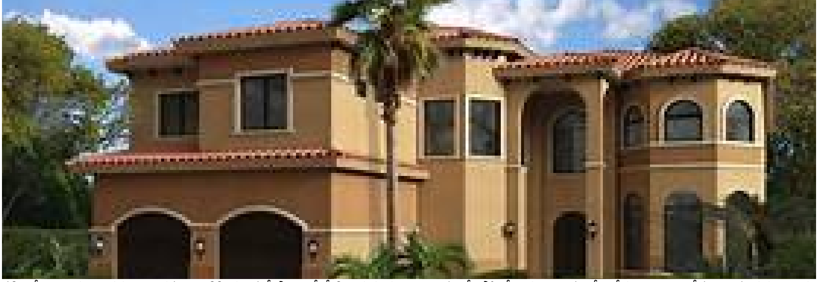
గట్టిగానే ఉన్నాయిని.. వర్షం, ఎండకు అన్నిటికీ తట్టుకునే స్థాయిలో వీటిని తయారు చేస్తున్నట్లుగా వివరించారు. అయితే ఈ ఇంటర్లాక్ ఇటుకల వల్ల మామూలుగా నిర్మించుకునే ఇటుకల కంటే ఈ ఇటుకలతో నిర్మాణ సమయం ఆదా మామూలు ఇటుకలతో పోలిస్తే ఈ ఇటుకలతో గోడలు చాలా వేగంగా కట్టవచ్చు. ఖర్చు తగ్గుతుంది. ఫ్లాస్టరింగ్ సిమెంటు ఖర్చులు తగ్గడం వల్ల మొత్తం నిర్మాణ వ్యయంలో 20% నుండి 30% వరకు ఆదా అయ్యే అవకాశం ఉందంటున్నారు. 10 ఏళ్లలో