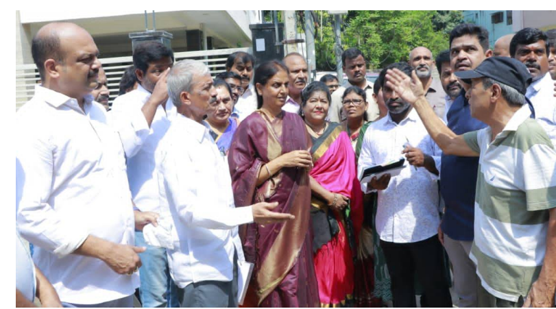
మూడు కార్పొరేషన్లకు సృష్టమైన బాధ్యతలు కేటాయించి సమస్యల పరిష్కారంపై దృష్టి పెట్టాలని సూచించారు. ఈ కార్యక్రమంలో జి.హెచ్.ఎస్. ఆర్కే పురం డివిజన్, సర్పంచర్ డివిజన్, ఎన్టీఆర్ నగర్ డివిజన్ చెందిన నాయకులు తదితరులు పాల్గొన్నారు.

వార్త మిర్చర్ రంగారెడ్డి జిల్లా ప్రతినిధి :మే 19 :- మహేశ్వరం నియోజకవర్గంలోని ఆర్కే పురం డివిజన్లో విజయపురి కాలనీలో పర్యటించిన మాజీ మంత్రి మహేశ్వరం ఎమ్మెల్యే సబితా ఇంద్రారెడ్డి ఎస్ఎన్టీపీ నాలా నిర్మాణ పనులు తీవ్రంగా అలస్యమవుతున్నాయని ఆందోళన వ్యక్తం చేశారు. కాలవల పనులు పూర్తి కాకపోవడంతో ట్రాఫిక్ సమస్యలు, రాకపోకలకు అంతరాయం ఏర్పడుతోందన్నారు. ఇప్పటికే వర్షాకాలం సమీపిస్తున్న నేపథ్యంలో పనులను వేగవంతం చేసి వెంటనే పూర్తి చేయాలని అధికారులను కోరారు. మధ్యలో నిలిచిపోయిన పనులను తిరిగి ప్రారంభించి, వర్షాల సమయంలో సగరం మునిగిపోకుండా ముందస్తు చర్యలు తీసుకోవాలని విజ్ఞప్తి చేశారు. మాజీ ముఖ్యమంత్రి కేసీఆర్ నగరాభివృద్ధి దృష్ట్యా మంచి ఆలోచనతో ఎస్ఎన్టీపీ నాలా ప్రాజెక్టును ప్రారంభించారని, అయితే ప్రస్తుతం పనులు నత్తనడకన సాగుతున్నాయని విమర్శించారు. దాదాపు రెండు సంవత్సరాలుగా పనులు కొనసాగుతున్నప్పటికీ ఇంకా పూర్తి కాలేదని పేర్కొన్నారు. అలాగే సగరంలో చెత్త సమస్య, తాగునీటి ఇబ్బందులు కూడా తీవ్రమవుతున్నాయని తెలిపారు. ఏజెన్సీ ప్రాంతాల్లో ట్యాంకర్ల ద్వారా నీటి సరఫరా జరుగుతోందని, ప్రజలు ఇబ్బందులు పడుతున్నారని అన్నారు. మున్సిపల్ శాఖ అధికారులు బాధ్యతగా పనిచేసి చెత్త తొలగించు, కాలవల శుభ్రత, తాగునీటి సరఫరాపై ప్రత్యేక దృష్టి పెట్టాలని కోరారు. వర్షాకాలానికి ముందే అన్ని డ్రైనేజీ, నాలాల పనులు పూర్తి చేసి ప్రజలకు ఇబ్బందులు లేకుండా చూడాలని ప్రభుత్వాన్ని విజ్ఞప్తి చేశారు. అలాగే సగరంలోని