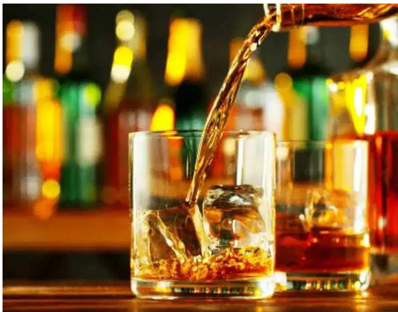
వీటి ధరలు 20% నుండి 30% వరకు పెరిగాయి. ఉదాహరణకు గతంలో రూ.80 కి లభించే ఒక సాధారణ క్యాప్సల్ బాటిల్ ధర ఇప్పుడు దాదాపు రూ.105 కి చేరింది. ప్రీమియం, విదేశీ బ్రాండ్ల/బడ్జెట్ బ్రాండ్లు (ఉదాహరణకు: బ్లూక్ లీబల్, చివాస్ రీగల్, దయాజియో, పెర్సోన్ రికార్డ్), కొన్ని మైల్డ్/లాగర్ బీర్ల ధరలు తగ్గుముఖం పట్టాయి. 6 నుండి 8వ స్లాట్ల వరకు ఉన్న మద్యంపై సుంకాన్ని 10% నుండి 15% తగ్గించడం వల్ల ఈ ప్రీమియం బ్రాండ్ల ధరలు 16% నుండి 25% వరకు తగ్గాయి. ఒకప్పుడు రూ.5,190 ఉన్న 750 మి.లీ బ్లూక్ లీబల్ లేదా చివాస్ రీగల్ బాటిల్ ధర ఏకంగా రూ.4,100 కి తగ్గింది. కొన్ని రకాల మైల్డ్ బీర్ల ధరలు కూడా బ్రాండ్లను బట్టి రూ.20 నుండి ?75 వరకు తగ్గాయి.