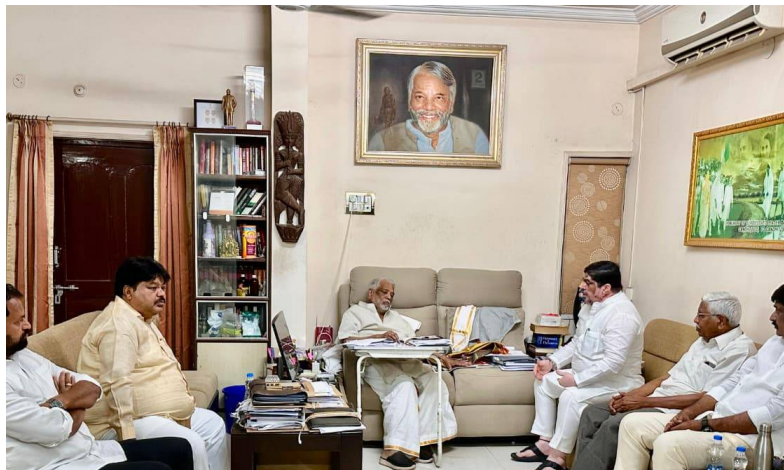
పరిపాలన శాఖ రాజకీయ విభాగం కార్యదర్శి కమిటీ కన్వీనర్ గా వ్యవహరించనున్నారు. కమిటీ ప్రధాన బాధ్యతలలో తెలంగాణ ఉద్యమకారులను గుర్తించేందుకు స్పష్టమైన ప్రమాణాలను రూపొందించడం, ఆయా ప్రమాణాల ఆధారంగా ఉద్యమకారుల సమగ్ర జాబితాను సిద్ధం చేయడం, వారికి అందించాల్సిన గౌరవాలు, గుర్తింపులు, సంక్షేమ సౌకర్యాలపై ప్రభుత్వానికి సిఫారసులు చేయడం వంటి అంశాలు ఉన్నాయి. తెలంగాణ రాష్ట్ర సాధన కోసం పోరాడిన ప్రతి ఉద్యమకారుడి సేవలను గుర్తించి, వారికి న్యాయం జరిగేలా ప్రభుత్వం కట్టుబడి ఉందని కమిటీ సభ్యులు ఈ సందర్భంగా పేర్కొన్నారు.