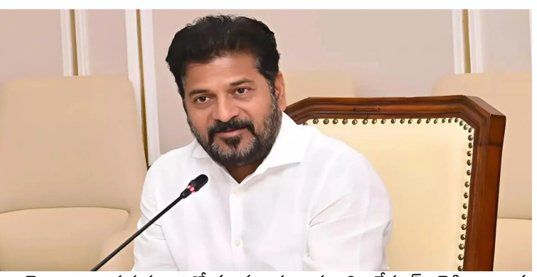
తెలంగాణ ప్రభుత్వ ఉద్యోగులకు ముఖ్యమంత్రి రేవంత్ రెడ్డి నాలుగు కీలకమైన శుభవార్తలు చెప్పారు.

ఉద్యోగుల సమస్యల పరిష్కారం తమ బాధ్యత అని స్పష్టం చేసిన ముఖ్యమంత్రి