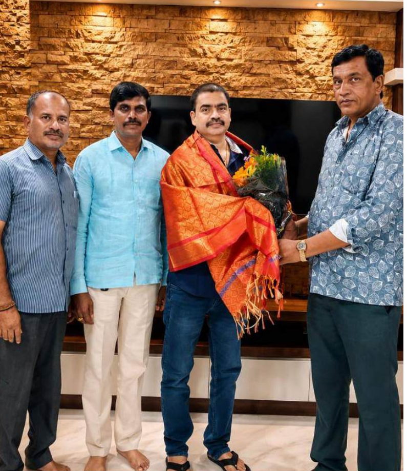
పరిష్కారానికి కృషి చేస్తామని తెలిపారు. కార్యక్రమంలో పలువురు సీనియర్ జర్నలిస్టులు, మీడియా ప్రతినిధులు, యువ జర్నలిస్టులు మరియు TYJF సభ్యులు పాల్గొని నూతన కమిటీకి శుభాకాంక్షలు తెలిపారు. సమావేశం అనంతరం సభ్యులంతా ఐక్యంగా పనిచేసి వీజీబీను రాష్ట్రంలో బలమైన జర్నలిస్టుల వేదికగా తీర్చిదిద్దాలని సంకల్పం వ్యక్తం చేశారు.