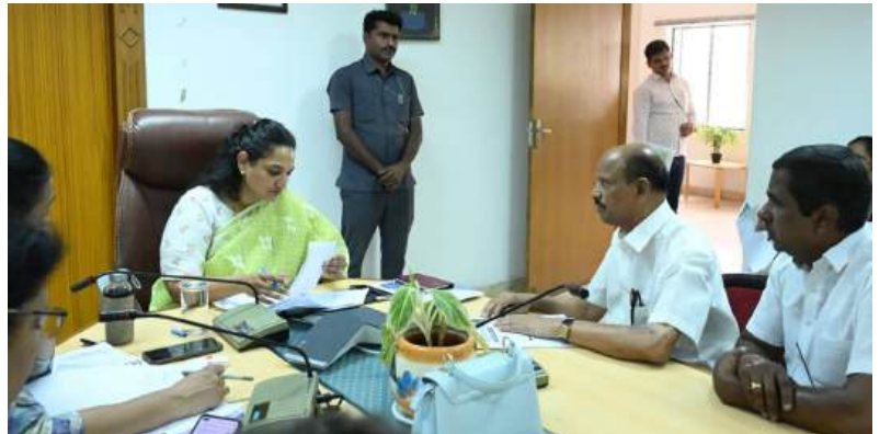
అర్బురైజ్మెంట్ 1, హౌసింగ్ 1, విజిటిస్ ఎస్సోసియేషన్ 1, ఎస్సెట్స్ 1 ఫిర్యాదులు వచ్చాయి. కమిషనర్ సంబంధిత విభాగాధిపతులతో కలిసి ప్రతి ఫిర్యాదును సమీక్షించి, క్షేత్రస్థాయి పరిశీలన చేసి నిర్దిష్ట గడువులో పరిష్కరించాలని ఆదేశించారు. ముఖ్యంగా టౌన్ షానింగ్ ఫిర్యాదులు అధికంగా ఉండటంతో వాటిపై ప్రత్యేక దృష్టి సారించి పెండింగ్ కేసులను త్వరితగతిన పరిష్కరించాలన్నారు. ప్రతి ఫిర్యాదును ప్రత్యేక ట్రాకింగ్ ఐడి ద్వారా పర్యవేక్షిస్తూ పారదర్శకంగా పరిష్కార ప్రక్రియ కొనసాగుతుందని తెలిపారు.

మాదాపూర్ వార్తా మిర్చర్ : సైబరాబాద్ మున్సిపల్ కార్పొరేషన్ కార్యాలయంలో సోమవారం నిర్వహించిన ప్రజావాణి కార్యక్రమానికి పౌరుల నుంచి విశేష స్పందన లభించగా మొత్తం 72 ఫిర్యాదులు నమోదయ్యాయి. టౌన్ షానింగ్ విభాగానికి సంబంధించిన అత్యధికంగా 41 ఉండగా, ఇంజనీరింగ్ 14, అర్బన్ బయోడ్రైవర్స్ 5, స్ట్రీట్స్ 3, శానిటేషన్ 2, రెవెన్యూ (ప్రావర్టీ ట్యాక్స్) 2, ఎలక్ట్రికల్ 1,