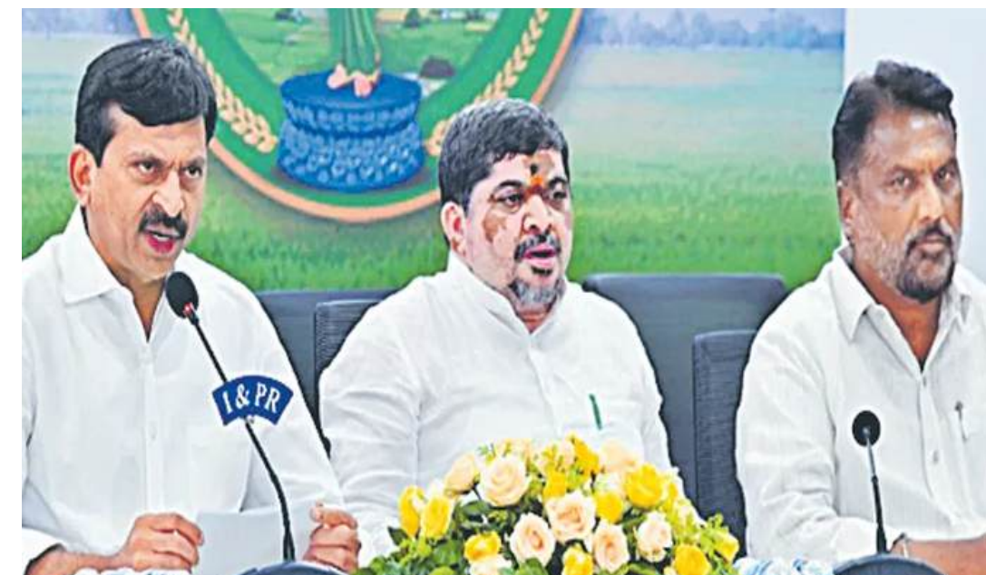
బడీబలు, అడ్వోకేట్ ట్రైనింగ్ సెంటర్లు, పాలిటెక్నిక్ కళాశాలలు, టీ-శాట్ ను యంగ్ ఇండియా స్కీల్స్ యూనివర్సిటీ పరిధిలోకి తీసుకురావాలని నిర్ణయించారు. అదేవిధంగా 33/11 కేబీ సబ్సిడీ వద్ద సౌర విద్యుత్ ప్లాంట్ ఏర్పాటుకు కేబినెట్ ఆమోదం తెలిపింది. ప్రయోగాత్మకంగా పలు జిల్లాల్లో 20 మెగావాట్ల సామర్థ్యంతో ప్లాంట్ల ఏర్పాటు చేయనున్నారు. గ్రేటర్ హైదరాబాద్, సైబరాబాద్, మల్కాజ్ గిరి పరిధిలో ప్రభుత్వ కార్యాలయాలపై పెండింగ్లో ఉన్న పన్ను బకాయిల పన్నులకు వన్ టైమ్ సెటిల్ మెంట్ అమలు చేయాలని నిర్ణయించారు. జరిమానాలు, వడ్డీలు మాఫీ చేసే భారీగా ఆదాయం వచ్చే