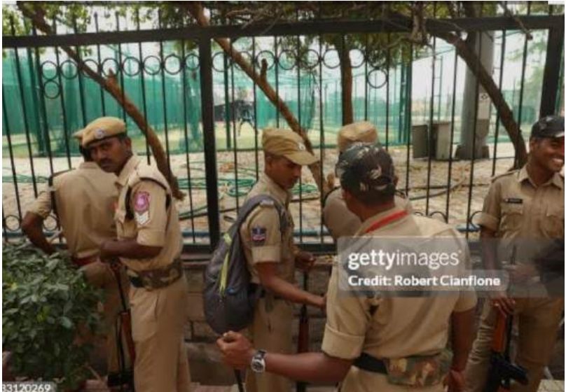
వారికి రావలసిన "సరెండర్ లీమ్" నిధులు మంజూరు కాక వేల సంఖ్యలో పోలీసులు ఆర్థిక ఊబిలో కొట్టుమిట్టాడుతున్నారు, ఒక్కొక్కరికి 3, నుంచి 5.లక్షల రూపాయల వరకు నిధులు విడుదల కావాలి ప్రభుత్వం అర్థం చేసుకోవాలి!

సెలవు లేదు దానికి బదులు వచ్చే వైసా లేదు..! సాధారణంగా ప్రభుత్వ ఉద్యోగికి ఆదివారం సెలవు ఉంటుంది, అని అది పోలీసులకు అత్యవసర సమయం ఏదాది అంతా కష్టపడి సెలవలు కూడా వాడుకోకుండా విద్యుత్తు నిమగ్నమయ్యే పోలీసులకు ఆ మిగిలిపోయిన సెలవులని సగదు రూపకంగా మార్చుకునే అవకాశం ఉంది ఆ నిధులు రాకపోవడంతో ప్రతి ఒక్క పోలీసు ఆర్థికంగా అల్లడిల్లుతున్నారు, తల్లితండ్రుల ఆరోగ్యం- పిల్లల స్కూల్ ఫీజు- పోలీసులకు తీరని అప్పులు మా పిల్లల స్కూల్ ఫీజులు కట్టాలని సరెండర్ ఫీజులపై సమూహం పెట్టుకున్నా బిల్లులు పెట్టుకొని సెలలు గడుస్తుంది పైసా రాలేదు "శాంతి భద్రతల కోసం లాల్ పట్టుకొని తలెత్తుకొని పనిచేస్తున్నాము" ఇంట్లో పిల్లల వాళ్ల భార్య ముందు తల దింకుకోవాల్సి వస్తుంది ఒక కానిస్టేబుల్ ఆవేదన! తక్షణమే ప్రభుత్వం స్పందించి వారి నిధులను మంజూరు చేయాలి యానిఫామ్ వెనక ఉన్న మనిషిని గుర్తించాలి! వారి త్యాగాలకు వెలకట్ట లేకపోయినా.. వారికి రావలసిన న్యాయబద్ధమైన సొమ్మును వెంటనే విడుదల చేయాలి..! కానిస్టేబుల్ కన్నుల్లో తుడిచే బాధ్యత పాలకులే..!