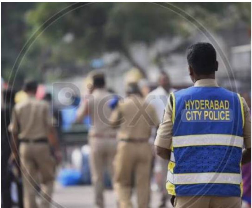
వార్త మిర్చర్ తెలంగాణ స్టేట్ బ్యూరో గణేష్ సాగర్ : తెలంగాణ రాష్ట్రంలో పోలీసులు చెమట చిందిస్తున్న వారి చేతికి అందని "సరెండర్ నిధులు" రాష్ట్రం నిద్రపోతున్న వారు మేలుకొనే ఉంటారు.. వండుగలకు దూరమై బంధువుల పలకరింపులకు కరువై సమాజ రక్షణ కొరకు ప్రాణాలను పణంగా పెడతారు, కానీ నేడు అదే పోలీస్ వ్యవస్థ నిస్సహాయ స్థితిలో కొట్టుమిట్టాడుతుంది, "గొంతు విప్పి అడగలేదు".." అలాగని ఆకలిని భరించలేదు..

కర్తవ్యం లో సింహాలు... కష్టాల్లో బీనులు! శాంతిభద్రతల రక్షకులపై ఆర్థిక భారం! ఇంట్లో పిల్లల ఫీజులు.... బయట వడ్డీల బాదుడు! ఆసుపత్రి ఫీజుల కోసం ఆరాటం.. సరెండర్ నిధుల కోసం పోరాటం! తక్షణమే నిధులు విడుదల చేయాలని ప్రభుత్వానికి విన్నపాలు! చెమట చిందించిన చేతికిందని సరెండర్ నిధులు!