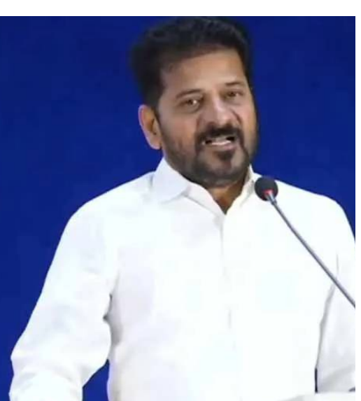
సీఎన్ఎల్ నిధుల్లో ఎక్కువ మొత్తాన్ని అదే ప్రాంత అభివృద్ధికి కేటాయించాలన్నారు. సీఎన్ఎల్ నిధుల వినియోగంలో ఇప్పటి వరకు సరైన విధానం లేనందున తాము ఒక ప్రత్యేక ప్రధాన కార్యదర్శిని ఇందుకు నియమించామని సీఎం తెలిపారు. కంపెనీల ప్రతినిధులు ఆయనతో సమన్వయం చేసుకొని తమకు ఆసక్తి ఉన్న విద్యా, వైద్యం, జల వనరులు, నైపుణ్య శిక్షణ, వారసత్వ కట్టడాల పరిరక్షణ, ఆదవుల సంరక్షణ

(మొదటి పేజీ తరువాయి) ప్రమాణాభివృద్ధికి చేసేది ఖర్చుగా కాకుండా భాగస్వామ్యంగా చూడాలని ముఖ్యమంత్రి ఎ.రేవంత్ రెడ్డి అన్నారు. సీఎన్ఎల్ నిధులకు సంబంధించి వివిధ కార్పొరేట్ కంపెనీల ప్రతినిధులతో ముఖ్యమంత్రి ఎ.రేవంత్ రెడ్డి బుధవారం సమావేశమయ్యారు. ఈ సందర్భంగా సీఎం రేవంత్ రెడ్డి మాట్లాడుతూ కంపెనీలు సీఎన్ఎల్ కు చేస్తున్న వ్యయం వందకు వంద శాతం సత్ఫలితాలు ఇచ్చేలా ఉండాలన్నారు. తమ ప్రభుత్వం విద్యా, వైద్యం, జల వనరుల సంరక్షణకు ప్రాధాన్యం ఇస్తుందని తెలియజేశారు. కంపెనీలు వీటితో పాటు తమకు ఇష్టమైన ఏ రంగాన్నైనా ఎంచుకొని సీఎన్ఎల్ నిధులు వినియోగించాలని సూచించారు. ప్రభుత్వంతో పాటు కంపెనీలు కలిపి చేసే వ్యయంతో తెలంగాణ విద్యార్థులను ప్రపంచ స్థాయి నైపుణ్యం ఉన్న వారిగా తీర్చిదిద్ది భవిష్యత్ అవకాశాలను వారు అందిస్తున్నారేలా తయారు చేయగలమని సీఎం అన్నారు. విద్యపై పెట్టే వ్యయాన్ని తాము భవిష్యత్ తరాలపై పెట్టే పెట్టుబడిగా భావిస్తున్నామని సీఎం తెలిపారు. రాష్ట్రంలోని విద్యార్థుల సంఖ్యలో హైదరాబాద్ నగరంలోనే 44 శాతం ఉన్నారని.. వారికి నాణ్యమైన విద్య అందించాల్సిన బాధ్యత మన అందరిపైన ఉండవచ్చు. కంపెనీలు స్థానికంగా ఉన్న అన్ని మౌలిక వసతులను వినియోగించుకుంటున్నందున తమ