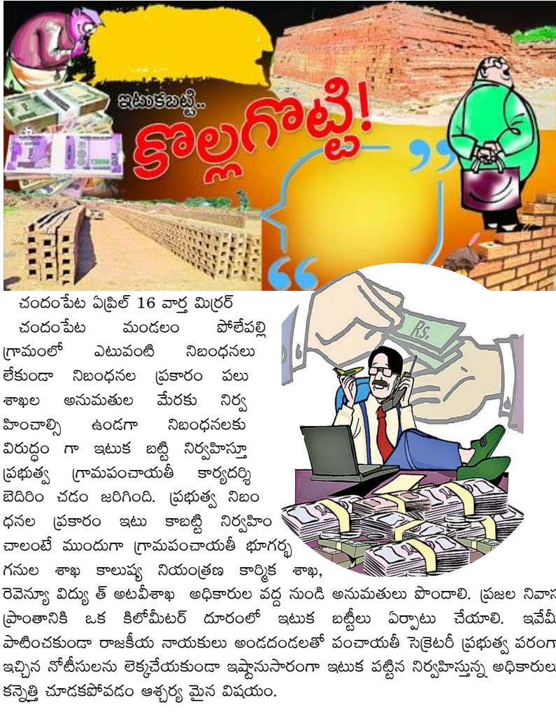
చందంపేట ఏప్రిల్ 16 వార్త మిర్చర్

చందంపేట మండలం పోలేపల్లి గ్రామంలో ఎటువంటి నిబంధనలు లేకుండా నిబంధనల ప్రకారం పలు శాఖల అనుమతుల మేరకు నిర్వహించాల్సి ఉండగా నిబంధనలకు విరుద్ధంగా ఇటుక బట్టి నిర్వహిస్తూ ప్రభుత్వ గ్రామపంచాయతీ కార్యదర్శి బెదిరిం చదం జరిగింది. ప్రభుత్వ నిబంధనల ప్రకారం ఇటుక బట్టి నిర్వహించాలంటే ముందుగా గ్రామపంచాయతీ భూగర్భ గనుల శాఖ కాలుష్య నియంత్రణ కార్మిక శాఖ, రెవెన్యూ విద్యుత్ అటవీశాఖ అధికారుల వద్ద నుండి అనుమతులు పొందాలి. ప్రజల నివాస ప్రాంతానికి ఒక కిలోమీటర్ దూరంలో ఇటుక బట్టిలు ఏర్పాటు చేయాలి. ఇవేమీ పాటించకుండా రాజకీయ నాయకులు అందందలతో పంచాయతీ సెక్రటరీ ప్రభుత్వ పరంగా ఇచ్చిన నోటీసులను లెక్కచేయకుండా ఇష్టానుసారంగా ఇటుక బట్టిన నిర్వహిస్తున్న అధికారులు కన్నెత్తి చూడకపోవడం ఆశ్చర్య మైన విషయం.