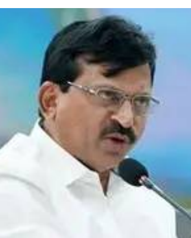
(మగతా 2వ పేజీలో)

ఖమ్మం : ఖమ్మం జిల్లాలో మంత్రి పాంగులేటి శ్రీనివాసరెడ్డి ప్రతిపక్ష బీఆర్ఎస్ పై తీవ్ర స్థాయిలో విరుచుకుపడ్డారు. తమ ప్రభుత్వంపై వస్తున్న ఆరోపణలు రాజకీయ ప్రేరేపితమని పేర్కొంటూ, అవి ప్రజలను తప్పుదోవ పట్టించే ప్రయత్నమని విమర్శించారు. కొందరు కావాలనే తప్పుడు ప్రచారం చేస్తూ, తమపై బురద జల్లే ప్రయత్నం చేస్తున్నారని ఆగ్రహం వ్యక్తం చేశారు. అయితే అలాంటి విమర్శలకు ప్రభుత్వం ఏమాత్రం వెనక్కి తగ్గబోదని స్పష్టం చేశారు. రాజకీయ విమర్శల పేరుతో అసత్యాలను ప్రచారం చేస్తున్న ప్రతిపక్షాలపై మంత్రి తీవ్ర వ్యాఖ్యలు చేశారు. ఎవరు ఎంతగా విమర్శించినా, ఎంతటి ఆరోపణలు చేసినా ప్రజల కోసం పనిచేసే