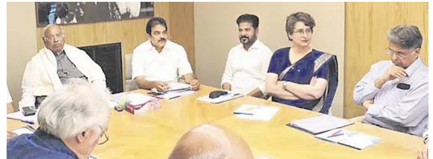
(మగతా 2వ పేజీలో)

తీసుకుంటున్న నిర్ణయాలను ప్రశ్నించారు. ఎలాంటి విస్తృత చర్చ లేకుండా నియోజకవర్గాల పెంపును అత్యవసరంగా తీసుకురావడం వెనుక రాజకీయ ఉద్దేశ్యాలున్నాయని ఆరోపించారు. దేశంలో సీట్ల సంఖ్యను భారీగా పెంచితే ఉత్తరాది రాష్ట్రాలకు అనుకూల పరిస్థితులు ఏర్పడి, చిన్న రాష్ట్రాలు ప్రాధాన్యం కోల్పోతాయని చెప్పారు. ప్రస్తుతం చిన్న రాష్ట్రాలు, పెద్ద రాష్ట్రాల మధ్య ఉన్న సీట్ల తేడా మరింత విస్తరించే అవకాశం ఉందని