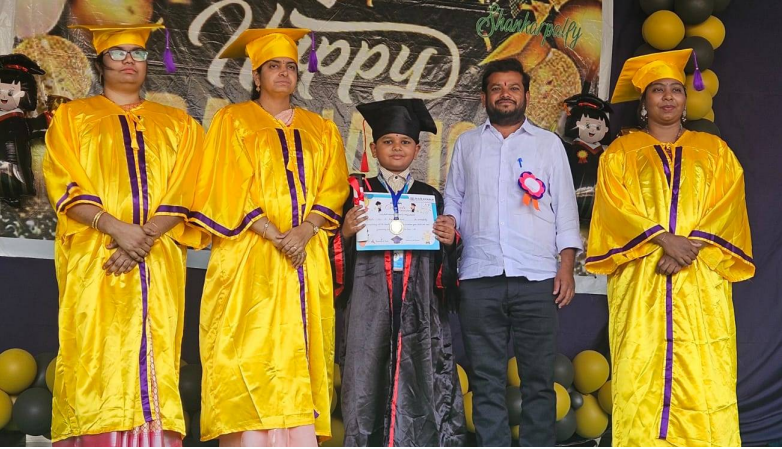
శంకర్ పల్లి, వార్త మిర్చర్: -నారాయణ విద్యాలయంలో గ్రాడ్యుయేషన్ డే వేడుకలు ఘనంగా నిర్వహించారు. ఈ సందర్భంగా విద్యార్థులు ఉత్సాహంగా పాల్గొని తమ విద్యా ప్రస్థానంలో ఒక ముఖ్యమైన మైలురాయిని చేరుకున్న ఆనందాన్ని వ్యక్తం చేశారు. ప్రధానోపాధ్యాయురాలు

- గగనానికి ఎగిసిన నారాయణ విద్యార్థుల గ్రాడ్యుయేషన్ డే -- కృషి ఫలితంగా విజయోత్సవం, ప్రధానోపాధ్యాయురాలు దివ్య ఆశాభావం