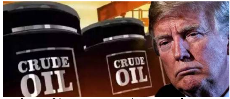
అంతర్జాతీయ మార్కెట్లో ముడి చమురు ధరలు ఒక్కసారిగా 15 శాతం మేర కుప్పకూలాయి. రెండు వారాల పాటు దాడులు నిలిపివేస్తున్నట్లు అమెరికా అధ్యక్షుడు డొనాల్డ్ ట్రంప్ ప్రకటించిన వెంటనే ప్రపంచ మార్కెట్లు సానుకూలంగా స్పందించాయి. బ్రెంట్ క్రూడ్ ఆయిల్ సుమారు 15.19శాతం తగ్గి, బ్యారెల్ కు 92.67డాలర్ వద్ద ట్రేడ్ వుతోంది. దబ్బాట్టేబి క్రూడ్ ఆయిల్ 15.02శాతం తగ్గి, బ్యారెల్ కు 96.03 డాలర్ వద్దకు చేరుకుంది. వంద డాలర్ల మార్పును దాటి ఆకాశాన్నంటుతున్న ధరలు ఒక్కసారిగా దిగిరావడం చమురు దిగుమతి చేసుకునే దేశాలకు పెద్ద ఊరటనిచ్చే అంశం.షోర్లుజ్ జలసంధి ఓపెన్ చేయడం ధరలు తగ్గడానికి ప్రధాన కారణం షోర్లుజ్ జలసంధిని తిరిగి తెరవాలని ఇరాన్ తీసుకున్న నిర్ణయం. ప్రపంచ చమురు, ఎల్ఎస్సీ సరఫరాలో దాదాపు 20 శాతం వాటా ఈ జలసంధి ద్వారానే జరుగుతుంది. యుద్ధ భయంతో నిలిచిపోయిన ఈ సరఫరా మార్కెట్లో-హిజ్బుల్లా మధ్య జరుగుతున్న పునరుద్ధరంచడానికి ఇరాన్ విదేశాంగ మంత్రి అబ్బాసి అరాఫ్ఘి అంగీకరించడంతో సరఫరా గొలుసు పుంజుకుంటుందనే ఆశలు విగురించాయి.ట్రంప్ కీలక ప్రకటన ఈ ఉద్రిక్తతలను తగ్గించడంలో పాకిస్తాన్ కీలక మధ్యస్థత్వం వహించడం గమనార్హం. ఇరాన్ పై దాడులను రెండు వారాల పాటు నిలిపివేస్తున్నట్లు ప్రకటించారు. నౌకల సురక్షిత ప్రయాణానికి హామీ ఇస్తూనే, కొన్ని సాంకేతిక పరిమితులను అమలు చేస్తామని తెలిపింది. ఈ ఒప్పందం కేవలం అమెరికా-ఇరాన్ మధ్యే కాకుండా లెబనాన్ లో ఇజ్రాయెల్-హిజ్బుల్లా మధ్య జరుగుతున్న పోరుపై కూడా సానుకూల ప్రభావం చూపుతుందని నిపుణులు భావిస్తున్నారు.స్థిరత్వం దిశగా ఇంధన మార్కెట్ ఫిలిప్సరి నుంచి చమురు మార్కెట్లో నెలకొన్న అనిశ్చితికి ఈ ఒప్పందంతో తెరపడింది. ఏప్రిల్లో రోజుకు 9 మిలియన్ బ్యారెళ్ల ఉత్పత్తి దెబ్బతింటుందని అంచనా వేసిన తరుణంలో, ఈ కాల్యాల విరమణ వార్త ధరలను అదుపులోకి తెచ్చింది. రాబోయే రెండు వారాల పాటు ఈ ఒప్పందం సజావుగా సాగితే అంతర్జాతీయ మార్కెట్లో ఇంధన ధరలు మరింత స్థిరపడే అవకాశం ఉంది.