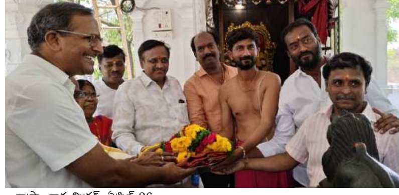
కాప్రా, వార్తా మిర్చి, ఏప్రిల్ 26