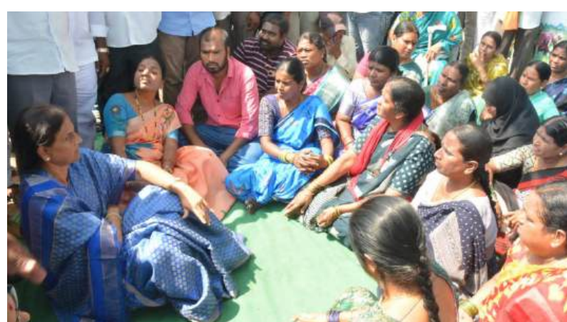
అవకాశం కల్పించాలి తక్షణమే రెవెన్యూ అధికారులు చర్యలు తీసుకోవాలి ఇంకా నెలలో వర్షాకాంక్ష ప్రారంభంవుతుంది. ఈ సమయంలో రైతులను అడ్డుకోవడం అంటే వారి జీవనాధారాన్ని దెబ్బతీయడమే" అని ఆమె అన్నారు. ప్రజల కోసం పని చేసే ప్రభుత్వం అయితే వెంటనే స్పందించాలని, రైతుల వక్షాన నిలబడాలని ఆమె డిమాండ్ చేశారు. తద్వారా రైతుల కోసం ఏడులోకి వచ్చి పోరాటం చేస్తామని హెచ్చరించారు.రైతు బతికితేనే దేశం బతుకుతుంది... రైతు గెలిస్తేనే న్యాయం గెలుస్తుంది అని ఘాటుగా స్పందించారు. అంతేకాకుండా, కాసుబాగు భూ బాధితుల పోరాటానికి పూర్తి మద్దతు తెలుపుతూ, న్యాయపరంగా, చట్టపరంగా అన్ని విధాల సహకారాన్ని భరోసా కల్పించారు.ఈ కార్యక్రమంలో నాదర్లలో ప్రాంతానికి చెందిన బిఆర్ఎస్ పార్టీ నాయకులు, మాజీ ప్రజా ప్రతినిధులు , కార్యకర్తలు, కాసుబాగు భూ బాధితులు భారీ సంఖ్యలో పాల్గొన్నారు.