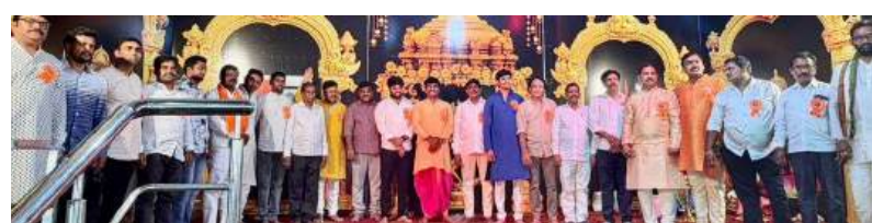
ఆలోచనలు మరియు కార్యాచరణను గుర్తుచేస్తూ, యువత మంచి మార్గంలో నడవాలని ప్రేరణనిచ్చారు.ఈ కార్యక్రమం ద్వారా సాంస్కృతిక చైతన్యం, హిందూ బంధుత్వం, ధర్మ మార్గం పట్ల ప్రజల్లో మంచి స్పందన ఏర్పడింది. ఆకర్షణీయంగా అలంకరించిన వేదిక మరియు సమగ్ర ఏర్పాట్లు కార్యక్రమానికి ప్రత్యేక శోభను తీసుకొచ్చాయి.హిందూ సమ్మేళన ఉత్సవ సమితి, బాలాజీ బస్టీ, మియాపూర్ సభ్యులు వాలంటీర్లు ఎంతో కృషితో కార్యక్రమాన్ని విజయవంతంగా నిర్వహించారు. సుమారు 2000 మందికి అన్నదానం నిర్వహించి సేవా భావాన్ని చాటిచెప్పారు.కార్యక్రమం ముగింపు సందర్భంగా ప్రేక్షకులు నిర్వాహకులను అభినందిస్తూ, ఇలాంటి హిందూ సమ్మేళన కార్యక్రమాలు నిరంతరం నిర్వహించాలనే ఆకాంక్షను వ్యక్తం చేశారు.