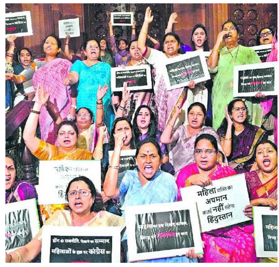
(మిగతా 2వ పేజీలో)