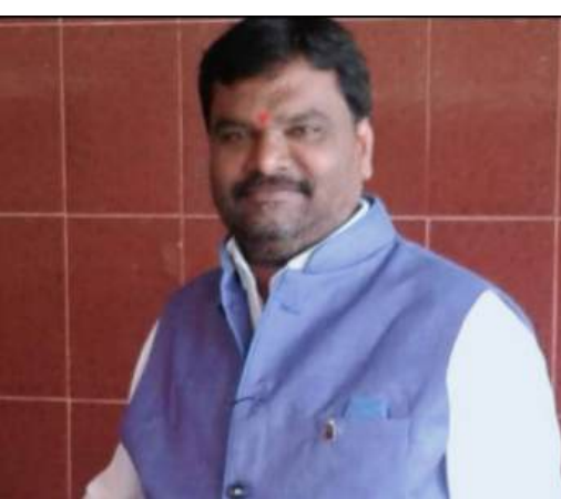
సభ్యత్వం వివరణ ఇవ్వాలని, ఇటువంటి బాధ్యతారహిత వ్యాఖ్యలు చేసిన సూర్యను ఎంపీ సభ్యత్వం రద్దు చేయాలని వారు డిమాండ్ చేశారు

లేదన్నారు. బీజేపీ నాయకత్వం ఎప్పటిలాగే ప్రాంతీయ విభేదాలను రెచ్చగొట్టి, ప్రజలను మతం-ప్రాంతం పేరిట విభజించి రాజకీయ లాభాలు పొందాలని చూస్తోందని విమర్శించారు. తేజస్వి సూర్య చేసిన వ్యాఖ్యలు బీజేపీ పార్టీ అసలు స్వరూపాన్ని బహిష్కారం చేస్తున్నాయన్నారు. ఇది కేవలం వ్యక్తిగత అభిప్రాయం కాదని, ఇది బీజేపీ దురహంకార రాజకీయాల ప్రతిబింబమన్నారు. తెలంగాణను అవమానించే ప్రతి ప్రయత్నాన్ని ప్రజలు తిరస్కరిస్తారన్నారు. ప్రజాస్వామ్యాన్ని బలహీనపరచే ఈ విధమైన వ్యాఖ్యలను దేశ ప్రజలు క్షమించరన్నారు. బీజేపీ ఎంపీ వెంటనే తన వ్యాఖ్యలను ఉపసంహరించుకొని తెలంగాణ ప్రజలకు బహిష్కార క్షమాపణ చెప్పాలని వారు డిమాండ్ చేశారు. తెలంగాణ విభజన గురించి పార్లమెంట్ లో మాట్లాడుతుంటే తెలంగాణ నుండి ప్రాతినిధ్యం ఇవ్వకుండా కేంద్ర మంత్రిలు, బీజేపీ ఎంపీలు నిద్రమత్తులో ఉన్నారని అని వారు ప్రశ్నించారు. బీజేపీ కేంద్ర నాయకత్వం ఈ అంశంపై