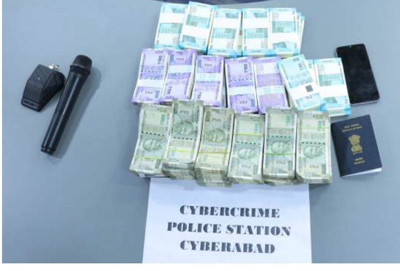
CYBERCRIME POLICE STATION CYBERABAD

సుమారు రూ.24 లక్షలు ఆక్రమణ లావాదేవీలు జరిపినట్లు పోలీసులు గుర్తించారు. నిందితుడి వద్ద నుండి మొబైల్ ఫోన్, పాస్ పోర్ట్ తో పాటు రూ.12 లక్షల నగదు స్వాధీనం చేసుకున్నారు. నిందితుడు తన పాత్రను అంగీకరించగా, ఇతర సహచరులను గుర్తించేందుకు, డబ్బు మార్గాన్ని ట్రేస్ చేయడానికి దర్యాప్తు కొనసాగుతోంది. ప్రజలు అనుమానాస్పద కార్మిక్, లింకులు, స్ట్రీమ్ షేరింగ్ యాప్స్, కెవైసి లేదా బ్యాంక్ పేరుతో వచ్చే సందేశాల పట్ల అప్రమత్తంగా ఉండాలని పోలీసులు సూచించారు.