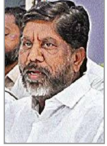
ఖమ్మం, : రాష్ట్రంలో భూమిలేని నిరుపేద వ్యవసాయ కూలీలకు ఏడాదికి రూ. 12 వేల చొప్పున ఆర్థికసాయం అందించబోతున్నామని ఉపముఖ్యమంత్రి మల్లు భట్టివిక్రమార్కు తెలిపారు. ఆరు నెలలకు రూ. 6 వేల చొప్పున ఏడాదిలో రెండు విడతలుగా ఈ మొత్తాన్ని పంపిణీ - మిగతా 2వ పేజీలో

ఆర్థిక సాయం అందజేతకు 28న శ్రీకారం ఆరు నెలలకోసారి రూ. 6 వేలు పంపిణీ అన్నదాతల కోసం రూ. 50 వేల కోట్ల ఖర్చు బీఆర్ఎస్ దుష్ప్రచారాన్ని ప్రజలు నమ్మరు గత ప్రభుత్వం చేసిన అప్పులపై అసెంబ్లీలో చర్చకు కేటీఆర్, హరీశ్ లు సిద్ధమా? నాటి అప్పులపై శ్వేతపత్రం విడుదల చేస్తాం ఉప ముఖ్యమంత్రి భట్టి విక్రమార్కు