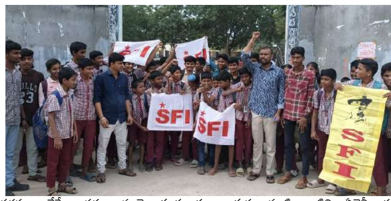
సరఫరా చేస్తే.. వప్పు, నూనె, కూరగాయలు, గుడ్లు వంటి వాటిని విజెస్సీవారు కొనుక్కొంటున్నారు. ఈ ఘటనల నుండి ప్రభుత్వం ఇప్పటికైనా నివారణా చర్యలు తీసుకోవాలి. విద్యావ్యవస్థ బలోపేతానికి తగిన నిధులు కేటా యించడం, రోజువారీగా ప్రభుత్వం ఇస్తున్న మెనూ అమలయ్యేలా చూడటం, ఈ పర్యవేక్షణ కోసం అవసరమైతే.. ప్రత్యేకంగా అధికారులను నియమించడం చేయాలి. సంక్షేమ వసతిగృహాలు, గురుకులల్లో సమస్యలు పరిష్కరించేందుకు చొరవ తీసుకోవాలి. బలహీన వర్గాలు చదువుతున్న ఈ విద్యా సంస్థలపై ప్రత్యేకంగా దృష్టి సారించకపోతే ఫుడ్ పాయిజన్ ఘటనలు భవిష్యత్తులోనూ పునరావృతమయ్యే ప్రమాదం ఉంది. ఇలాంటి ఘటనల వల్ల విద్యార్థులు చదువుకోవాలన్నా వారి తల్లిదండ్రులు పాఠశాలల్లో చేర్పించాలన్నా సంశయం చే పరిస్థితి వస్తుంది. విద్య అంటే బరువు కాదని, భవిష్యత్తుకు భరోసా అనే చైతన్యాన్ని సమాజానికి కలిగించాలి. వరుస ఘటనలపై ముఖ్యమంత్రి బాధ్యత వహించాలి అలాగే ఫుడ్ పాయిజన్ తో మృతి చెందిన విద్యార్థుల మృతి కూడా ప్రభుత్వమే బాధ్యత వహించాలన్నారు. లేని పక్షం లో ఎస్.ఎఫ్.ఐ ఆధ్వర్యంలో అందోహా కార్యక్రమంలో చేస్తాం అని ప్రభుత్వాన్ని హెచ్చరించారు.ఈ కార్యక్రమంలో ఎస్ఎఫ్ఐ మండల నాయకులు తాగుగూర్ మురళీ కార్తీక్ కేశావత్ సాయికుమార్ లక్ష్మణ్ చరణ్ అంజ్ వెంకట్ మున్నూ తదితరులు పాల్గొన్నారు.