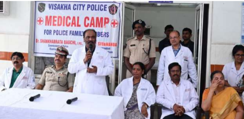
కుటుంబ సభ్యుల వైద్య పరీక్షలు వివరాలు డిజిటల్ రూపంలో పొందుపరచడం జరుగుతుంది. అదేవిధముగా మానసిక ఆరోగ్యం పట్ల పోలీసులు మరింత శ్రద్ధ కనబరచాలి, కుటుంబ సమస్యలు, ఆర్థిక సమస్యలు, మద్యపానం, అప్పు తీసుకోవడం వంటి ఇతర సమస్యల వల్ల కూడా మానసిక సమస్యలతో బాధపడుతున్న వారి కోసం వారి కుటుంబ సభ్యులు గుర్తించి మాకు తెలియ జేస్తే మేము మీ పేరు బయటకు రాకుండా వారికి తగు చికిత్స అందజేస్తామని తెలిపారు. పోలీసు కుటుంబ సభ్యులకు , యెటువంటి సమస్యలు ఉన్నా తాము ఇచ్చిన తెలిపారు.