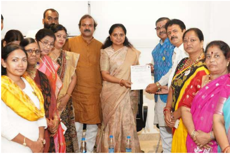
అందించాలి. 11)తెలంగాణ ప్రభుత్వం కొండా లక్ష్మణ్ బాపూజీ పేరిట అవార్డు ల కింద 1 లక్ష రూపాయలు, మెమెంటో ఇవ్వాలి. తెలంగాణ రాష్ట్రంలో బీసీలకు చట్టసభలో రిజర్వేషన్లు వచ్చేవరకు కృషి చేస్తే, మేము మీతో కలిసి పని చేస్తాం పద్మశాలీ కి రావాల్సిన వాటా ఇవ్వాలిందే.