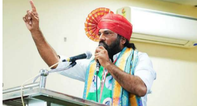
పరిస్థితుల్లో గిరిజనులు పేదరికంతో బిక్కుబిక్కుమంటూ అరకూర వసతులు తో జీవనం సాగిస్తున్నారు పేదవారి సొంత ఇల్లు కట్టుకునే కల నెరవేరాలని ఆవేదన వ్యక్తం చేశారు.