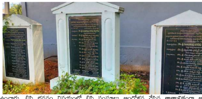
ఉంచారు. బిసెల భవనం విషయంలో బిసెల సంఘాలు ఆందోళన చేసిన తాత్కాలికంగా ఆ సంఘాలకు కొన్ని రోజులు సమావేశాలు నిర్వహించేందుకు ఇచ్చారు. ఆయా కుల సంఘాల సమావేశాలకు భవనాలు ఇవ్వాలని నాయకులు కోరుతున్నారు.