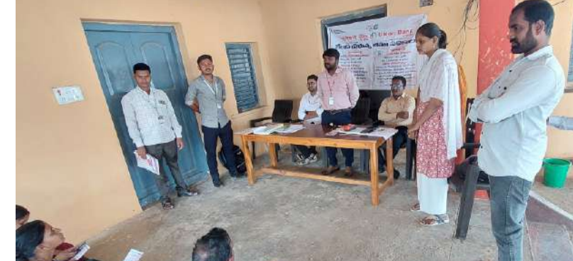
వార్త మిర్రర్ రాయకల్ ప్రతినిధి డిసెంబర్ 24 : భారత ప్రభుత్వ ఆర్థిక మంత్రిత్వ శాఖ మరియు ఆర్థిక సేవల విభాగం ఆధ్వర్యంలో డిసెంబర్ 15 నుంచి జనవరి 15 వరకు