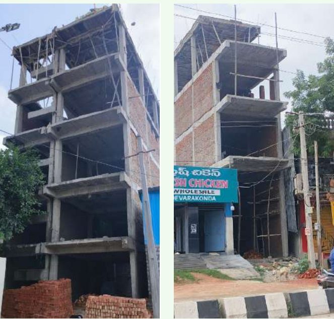
అక్రమ నిర్మాణాల చేపడుతున్న వారికి దాసోహం అవుతున్నారు. ఇలాంటి అక్రమ నిర్మాణాలు చేపట్టే వారికి టౌన్ ప్లానింగ్ అధికారులు అక్రమ నిర్మాణాలను నిలిపివేయాలని నోటీసులను కూడా పంపించడంలో టౌన్ ప్లానింగ్ అధికారులు పూర్తిగా విఫలమయ్యారు.

దేవరకొండ డిసెంబర్ 01 వార్త మిర్రర్ : దేవరకొండ పట్టణంలో ఎక్కడ చూసినా అక్రమ కట్టడాలు దర్శనమిస్తున్నాయి. పట్టణంలోని కొన్నిచోట్ల అక్రమ కట్టడాలు కడుతున్న ఉన్నతాధికారులు చర్యలు తీసుకోవడంలో వెనకాడుతున్నారు. జి.ప్లస్.జి.ప్లస్ 1, అనుమతి నాలుగైదు అంతస్తులు అక్రమ కట్టడాలు నిర్మించడం అన్న పెంట్ హౌస్ లో కూడా నిర్మాణం చేపడుతున్న అధికారులు చర్యలు తీసుకోవడంలో వెనుకడుగు వేస్తున్నారు. అధికారులు ప్రభుత్వాలకు తోడులుగా పనిచేస్తున్నారా లేక ప్రజల కోసమే పని చేస్తున్నారా ఇలాంటి అక్రమ నిర్మాణాలు చేపట్టే యజమానులకు వారిచే మామూలుగా దాసోహం అవుతున్నారా అనే ప్రశ్నలు పట్టణంలో స్థానికుల్లో మెదలాడే అంశం...?? దేవరకొండ పట్టణంలో డి.డి రోడ్డు లో దేవరకొండ పట్టణానికి చెందిన వ్యాపారవేత్త దేవరకొండ మున్సిపాలిటీ పరిధిలో నిర్మాణం చేపట్టిన బిల్డింగుకు జి.ప్లస్-2 అనుమతి దేవరకొండ మున్సిపల్ కార్పొరేషన్ నుండి తీసుకున్నారు. నిర్మాణంలో ప్రభుత్వానిబంధనల ప్రకారం నిర్మించకుండా వారి ఇష్టానుసారంగా నిర్మాణం చేపట్టడం వారికే చెల్లింది. అనుమతి తీసుకున్నప్పుడు టౌన్ ప్లానింగ్ అధికారి ప్రభుత్వం నుండి అనుమతించిన నిర్మాణాల మేరకే నిర్మాణం చేపట్టాలని అప్పటి అధికారి సూచించగా ఇటీవల కాలంలో బదిలీపై వెళ్లిన టౌన్ ప్లానింగ్ అధికారి స్థానంలో మరొక టౌన్ ప్లానింగ్ అధికారి రాగ వారి అందడంతో ప్రభుత్వం నియమ నిబంధనలు తుంగలో తొక్కి వారి ఇష్టానుసారంగా నిర్మాణం చేపడుతున్నారు. ఇదంతా చోద్యం చూస్తున్న టౌన్ ప్లానింగ్ అధికారి మాత్రం అంతే ఉంటున్నట్లు నిబంధనలకు విరుద్ధంగా నిర్మించే భవనాన్ని మాత్రం సందర్శించకుండా నిర్మాణదారులు అందించే తగిలాలకు దాసోహం అవుతూ అక్రమ నిర్మాణాలను అధికారుల అధ్యక్షంలో ముందల మూడు బిల్డింగులు వెనుక ఆరు స్థావులుగా నిర్మాణం జరుగుతుంది..