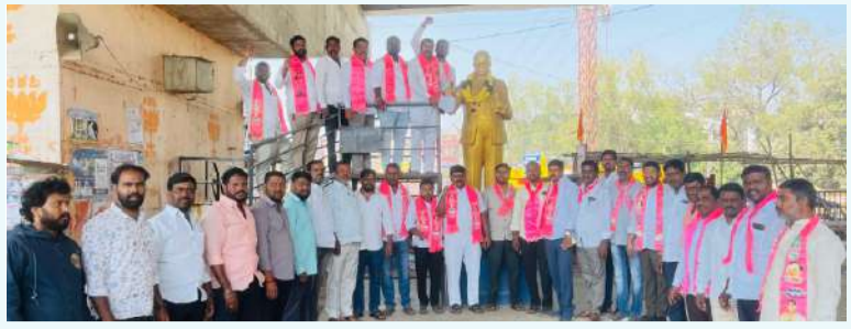
లగచర్ల రైతులను వెంటనే విడుదల చేయాలి

రాష్ట్రంలో వివిధ కారణాలతో బడి మానేస్తున్న బాలికల సంఖ్య పెరిగిపోవడం అందోళనకరమైన అంశమని వైద్య ఆరోగ్య శాఖ మంత్రి దామోదర రాజనర్సింహ అన్నారు. పాఠశాలల మూసితోపై బీఆర్ఎస్ సభ్యులు అడిగిన ప్రశ్నకు ఆయన సమాధానం ఇస్తూ.. విద్య, వైద్యం ప్రభుత్వ బాధ్యత అన్నారు. పాఠశాలల్లో విద్యార్థుల సంఖ్య 22 లక్షల నుంచి 18 లక్షలకు తగ్గిపోవడం బాధకరమన్నారు. 2023-24లో 1745 సూక్ష్మలో, 2024-25లో 1913 సూక్ష్మలో విద్యార్థులు చేరలేదని వివరించారు. ఉపాధ్యాయ నియామకాల తర్వాత 79 సూక్ష్మలో తరగతులను పునఃప్రారంభించినట్లు తెలిపారు.