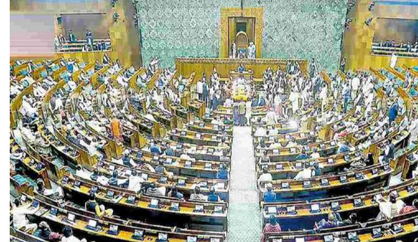
ఇది అప్రజాస్వామికం, రాజ్యాంగ వ్యతిరేకమని కూడా వాదిస్తున్నాయి.