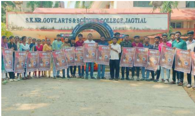
వార్త మిర్చర్ రాయికల్ ప్రతినధి డిసెంబర్ 10 : అఖిల భారతీయ విద్యార్థి పరిషత్ ఏజీవీపీ 43 వ రాష్ట్ర మహాసభలు డిసెంబర్ 23, 24, 25 తేదీలలో సిద్దిపేట జిల్లాలో జరగనున్నాయి. ఈ సందర్భంగా జగిత్యాల జిల్లా కేంద్రంలోని ఎన్ కేఎన్ఆర్ ప్రభుత్వ డిగ్రీ