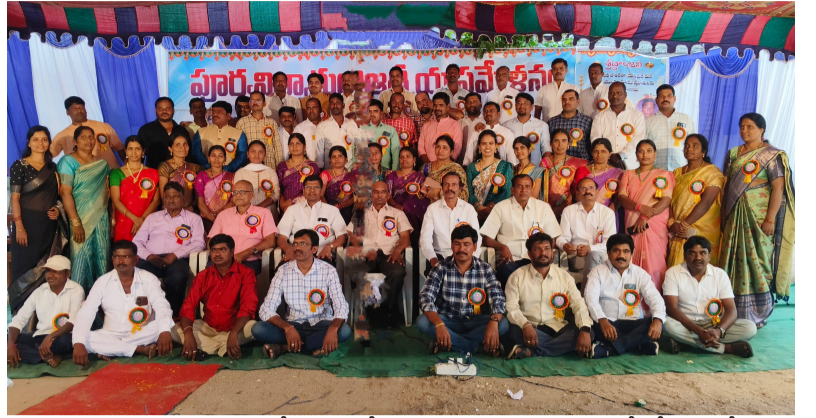
ఇలా ఏదైనా కాని మన వెన్నుంటే ఉండి నేనున్నాను అంటూ ధైర్యం చెప్పేదే ఒక స్నేహం...