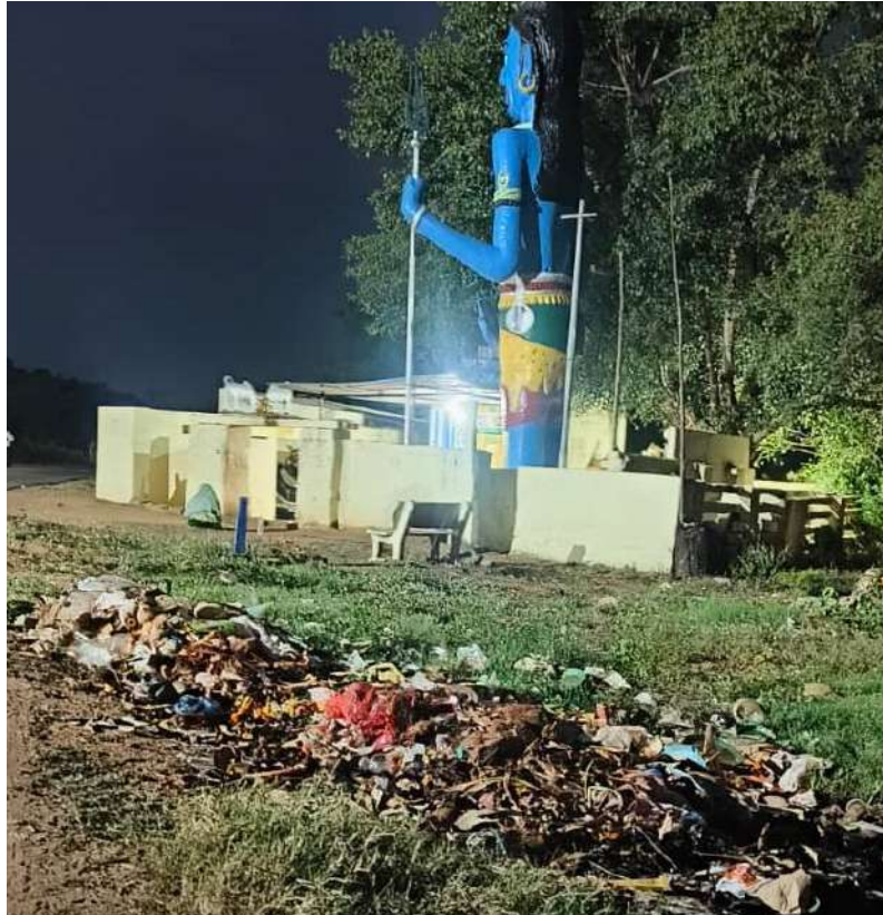
కొనసాగితే భక్తుల విశ్వాసం నన్నగిల్లడంతో పాటు భక్తుల అగ్రహానికి గురికావాల్సి వస్తుందని వారు అంటున్నారు.పాలకమండలి ఏర్పాటు పై ఉన్న క్రద్ధ ఆలయ పరిశుభ్రత లేకపోవడం కోసమెరుపు.