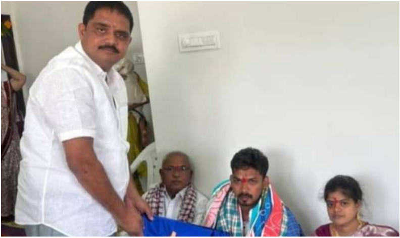
పలు ప్రాంతాల్లో నూతన గృహప్రవేశ