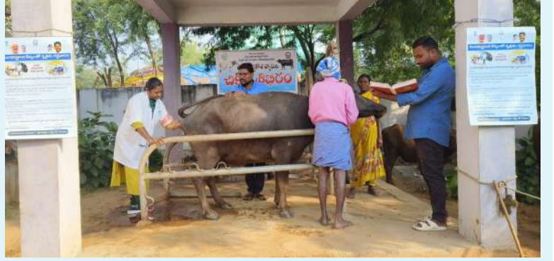
పశు సంవర్ధక శాఖ ఆధ్వర్యంలో గోపాలమిత్ర వైద్య శిబిరం