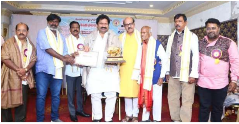
భాగ్యనగర్ వార్త మిర్చర్ ప్రతినిధి (గణేష్ సాగర్) : రవీంద్ర భారతి సభ సమావేశం మందిరంలో 14 వ తెలుగు సాహిత్య కళా పీఠం ఆవిర్భవ దినోత్సవ ప్రతిభ పురస్కారాల ప్రధానం కవి, పండిత విశిష్టత ప్రతిభా పురస్కారంలో పాల్గొన్న తెలంగాణ గౌడ సంఘం రాష్ట్ర

తెలంగాణ రాష్ట్ర భాష సాంస్కృతిక శాఖ సాజన్యంతో తెలుగు సాహిత్య కళాపీఠం 14వ ఆవిర్భవ దినోత్సవ వేడుకలో