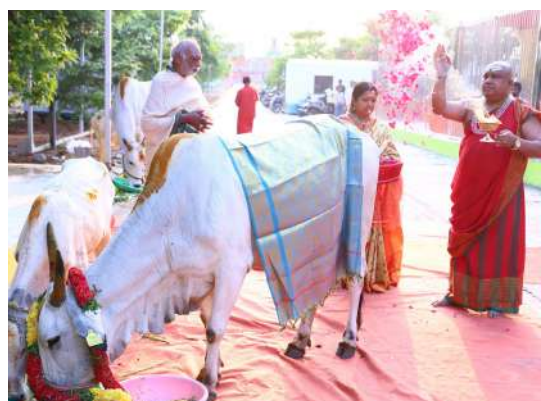
బహిర్యాగ విధానంతో త్రిపురాస్యనం చేసి షోడశోపచార పూజనం చేసారు. సహస్ర యంత్ర పూజ, శాస్త్రోక్తంగా చేశారు.