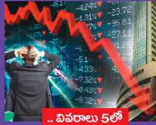
వివరాలు 5 లో

● మార్కెట్ ను కుదిపేసిన ఘర్షణ వాతావరణం ● ఆవిరైన దాదాపు రూ. 11 లక్షల కోట్లు