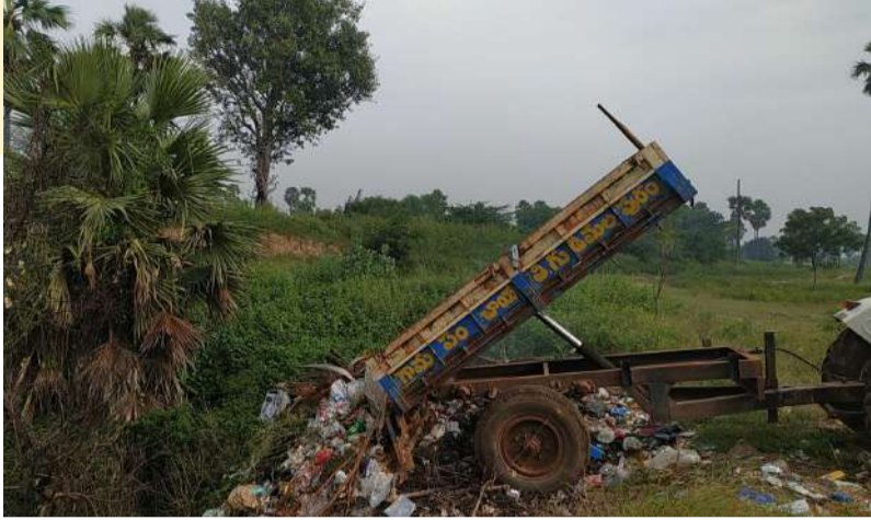
(భువనగిరి యాదాద్రి - వార్త మిర్చర్ ప్రతినీధి)

చెత్త డంపింగ్ కేంద్రాన్ని నిరుపయోగంగా పెట్టి, ఊట బావులను డంపింగ్ కేంద్రాలుగా మారుస్తున్న వైసీపీ యాదాద్రి భువనగిరి జిల్లా సంస్థాన నారాయణపురం మండల పరిధిలోని గుడిమల్యాపురం గ్రామంలో చోటు చేసుకుంది. ఊట బావులలో చెత్త వేయడాన్ని స్థానిక రైతులు తీవ్రంగా వ్యతిరేకిస్తున్న గ్రామపంచాయతీ సిబ్బంది తమకేమీ పట్టనట్లు వ్యవహరిస్తున్నారు. గ్రామంలోని చెత్తను సేకరించి డంపింగ్ యార్డ్ లో తడి, పొడి చెత్తగా వేరు చేయాల్సింది బద్ధకించి, చెత్తనంతా గ్రామంలోని ఊట బావులలో వేస్తూ చేతులను దులుపుకుంటున్నారు. గ్రామంలో చెత్త డంపింగ్ కేంద్రాన్ని నిరుపయోగంగా పెట్టి, ఊట బావులలో చెత్త వేస్తున్న వైసీపీ గ్రామ కార్యదర్శి ఎలా సమర్థించుకుంటారని స్థానికులు ప్రశ్నిస్తున్నారు. గ్రామంలో సేకరించిన చెత్తని వచ్చని పొలాల మధ్యలో ఉన్న బావుల్లో వదలేస్తున్నారని స్థానికులు మండిపడుతున్నారు. ఎన్నిసార్లు ఫిర్యాదు చేసినా గ్రామపంచాయతీ అధికారులు పట్టించుకోవడం లేదని ఆగ్రహాన్ని వ్యక్తం చేస్తున్నారు. చెత్తను బావులలో వేయడం వల్ల ఊటలోని వీధి కుక్కలు స్వేద విహారం చేస్తూ స్థానికంగా ఉన్న రైతుల పశువుల పై దాడి చేస్తున్నారన్నారు. గ్రామం నుంచి సేకరించిన చెత్తను బావులలో వేసి అక్కడే నిప్పు పెట్టడం వల్ల వాటి నుంచి వెలువడే వాయు కాలుష్యం వల్ల స్థానిక రైతులకు శ్వాస సంబంధిత వ్యాధుల బారిన పడుతున్నారని తెలిపారు. గ్రామ డంపింగ్ యార్డ్ ను నిరుపయోగంగా పెట్టి, బావులలో చెత్త వేస్తున్న గ్రామపంచాయతీ పాఠశుద్ధు సిబ్బందిపై, సిబ్బందిని పర్యవేక్షించడంలో విఫలమైన గ్రామ కార్యదర్శి పై మండల పంచాయతీ అధికారి తక్షణమే స్పందించి తగిన చర్యలు తీసుకోవాలని గుడిమల్యాపురం గ్రామస్థులు కోరుతున్నారు.