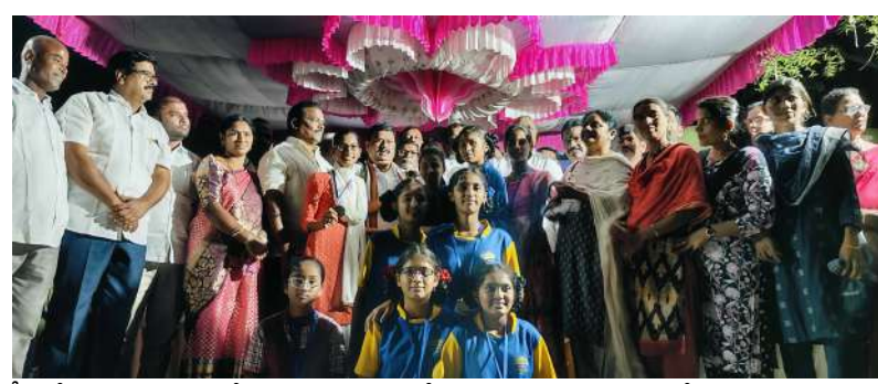
క్రీడల్లో గెలుపొందిన విజేతలకు ప్రధమ, ద్వితీయ బహుమతులు అందజేయడం జరిగింది.ఈ కార్యక్రమంలో స్థానిక ప్రజాప్రతినిధులు, అధికారులు, కాంగ్రెస్ నాయకులు, వివిధ అనుబంధ సంఘాల నాయకులు, యువజన విభాగ నాయకులు తదితరులు పాల్గొన్నారు.