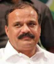
- మాజీ ఎమ్మెల్యే కర్నూల ప్రభాకర్

సంస్థాన్ నారాయణపురం గ్రామంలో బోడ్రాయి పండుగ విషయంలో గత వారం రోజులుగా “వార్త మిర్సా” దినపత్రికలో ప్రచురిస్తున్న బోడ్రాయి పండుగ నోచుకోని సంస్థాన్ “పేరిట బోడ్రాయి పండుగను జరుపుకోవాలన్న గ్రామ పెద్దల నిర్ణయాలు గ్రామ కుల సంఘాల నాయకుల ప్రత్యేక ఇంటర్వ్యూతో వారి వాదనలు వినిపించడం జరిగింది. గ్రామంలో బోడ్రాయి పండుగపై చర్చలు తీవ్రస్థాయిలో రావడంతో బోడ్రాయి పండుగ నిర్వహణపై మాజీ ఎమ్మెల్యే కర్నూల ప్రభాకర్ దృష్టికి వెళ్లడంతో ఆయన కూడా సానుకూలంగా స్పందించారు. గ్రామ ప్రజలలో బోడ్రాయి పండుగ నిర్వహించాలని కోరిక బలంగా ఉంటే తప్పకుండా గ్రామ మంది కోసం గ్రామంలోని పెద్దలతో, కుల సంఘాల నాయకులతో కలిసి మాట్లాడి బోడ్రాయి పండుగను జరుపుకునేలా తన వంతు కృషి చేస్తానని తెలిపారు. నడి చౌరస్తాలో ఉన్న శ్రీ రామలింగేశ్వర ఆలయాన్ని ఎలా పునర్నిర్మాణం చేపట్టామో అలాగే గ్రామంలో బోడ్రాయి ని పునర్నిర్మించి, పండుగను నిర్వహించే ప్రయత్నం చేద్దామని పేర్కొన్నారు..