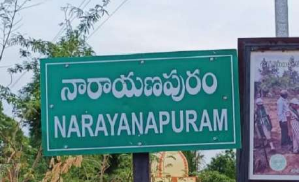
(గోల్లాల గణేష్ సాగర్ / వార్త మిర్సా ప్రతినిధి)

గ్రామం సుభిక్షంగా ఉండాలంటే బోడ్రాయి పండుగ నిర్వహించాలని, అప్పుడే గ్రామానికి మంచి జరుగుతుందనిపలువురు ప్రముఖులు సూచిస్తున్నారు. గ్రామస్థుల అభిప్రాయం మేరకే బోడ్రాయి పండుగను నిర్వహించాలని సూచిస్తున్నారు. రోడ్డుకు సమానంగా బోడ్రాయి ఉండడం గ్రామానికి మంచి కాదని, శ్రీ రామలింగేశ్వర స్వామి దేవాలయం తరహాలో బోడ్రాయి పునర్నిర్మాణం జరగాలని కోరుతున్నారు. అప్పుడే గ్రామానికి మంచి జరుగుతుందని, గ్రామ సంక్షేమాన్ని దృష్టిలో పెట్టుకొని యువజన సంఘాలు, స్వచ్ఛంద సంఘాలు, కుల సంఘాలు, రాజకీయాలకతీతంగా గ్రామ పెద్దలు ఏకమై బోడ్రాయి పండుగ నిర్వహణపై గ్రామంలో నూతనశాలను నిర్వహించాలని పలువురు కోరుతున్నారు. ప్రజాభిప్రాయం మేరకు బోడ్రాయి పండుగ నిర్వహణపై చర్చించి, ఏకాభిప్రాయంతో పండుగను నిర్వహిస్తే గ్రామానికి మంచిదని అంటున్నారు.