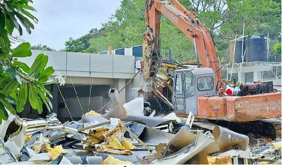
అంగుళం భూమిని ఆక్రమించలేదు!

అనధికారికంగా నిర్మాణాలు చేశారని, దీనిపై ఫిర్యాదులు రావడంతో కూల్చివేసినట్లు కమిషనర్ రంగనాథ్ వెల్లడించారు. 2014లో హెచ్ఎండిపీ తమ్మిడికుంట చెరువు ఎఫ్ఓఎల్, బఫర్ జోన్లకు ప్రాథమిక నోటిఫికేషన్ జారీ చేయగా, 2016లో పైసల్ నోటిఫికేషన్ విడుదల చేసినట్లు తెలిపారు. ప్రాథమిక నోటిఫికేషన్పై ఎన్ కన్వెన్షన్ యజమాన్యం హైకోర్టుకు వెళ్లినది, చట్టప్రకారం నడుచుకోవాలని, ఎఫ్ఓఎల్ నిబంధనలను పాటించాలంటూ ఆనాడు హైకోర్టు ఆర్డర్ ఇచ్చినట్లు తెలిపారు. ఆ తర్వాత ఎఫ్ఓఎల్ సర్వే పూర్తిచేసి, ఆ నివేదికను ఎన్ కన్వెన్షన్ యజమాన్యానికి అధికారులు అందించారని తెలిపారు. అనంతరం కన్వెన్షన్ యజమాన్యం మియాపూర్ అదనపు జిల్లా జడ్జి కోర్టును ఆశ్రయించింది, ఈ కేసు ఆ కోర్టులో పెండింగ్లో ఉన్నదని తెలిపారు. ఇది తప్ప.. ఏ కోర్టు కూడా స్టే ఆర్డర్ ఇవ్వలేదని హైద్రా కమిషనర్ వెల్లడించారు.