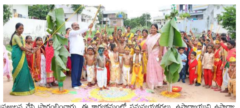
ప్రజ్వలన చేసి ప్రారంభించారు. ఈ కార్యక్రమంలో సమన్వయకర్తలు, ఉపాధ్యాయుని ఉపాధ్యాయులు, తల్లిదండ్రులు పాల్గొన్నారు.