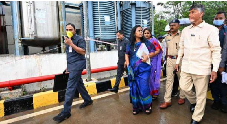
లక్షలు ఇస్తున్నాం. ఏమాత్రం కూడా ఎవరికీ ఏ ఇబ్బంది లేకుండా అన్నివిధాల ఆదుకోనే బాధ్యతను మేము తీసుకుంటాం. విశాఖపట్నం నాకు మనస్సుకు దగ్గరైన సీటీ. హుద్దాద్ సమయంలో మేం ఏవిధంగా చేశామో అందరూ చూశారు. ఇలాంటి సీటీ విషయంలో సేఫ్టీ మెజర్స్ అంతా ప్రక్షాళన చేయాలి. భవిష్యత్లో ఎలాంటి సంఘటన జరగకూడదని ఆలోచించే సమయంలో ఒక దురదృష్టకరమైన సంఘటన, బాధాకరమైన సంఘటన జరిగింది. దీన్ని ఇదే చివరిది కావాలని నేను కోరుకుంటున్నా. బాధితులను చూశాక, వారి దైర్ఘ్యం చూశాక వెంటనే కోలుకుంటారనే ఆశాభావం నాకు కలిగింది. మీడియా కూడా ఇలాంటి సంఘటనలు జరిగినప్పుడు ప్రజలకు, కుటుంబసభ్యులకు అందగా ఉన్నామనే దైర్ఘ్యం కలిగించాలి. మళ్ళీ వారిని మామూలు వ్యక్తులుగా తయారు చేయాలి. మేనేజ్మెంట్లో ఏమైనా అవకతవకలు జరిగి ఉంటే వారిపై చర్యలు తీసుకుంటాం.