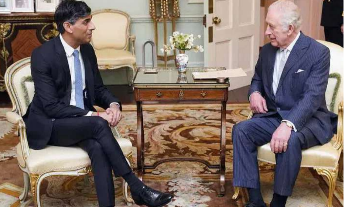
పౌండ్లు) సంపాదించగా, ఆయన సతీమణి అక్షతామూర్తి డివిడెండ్ల రూపంలో ఏకంగా రూ.137 కోట్లు (13 మిలియన్ పౌండ్లు) అందుకున్నారు. వీరి ఆస్తిలో సింహభాగం అక్షతామూర్తికి ఇన్వెస్టింగ్ ఉన్న షేర్ల కావడంతో ఇది గణనీయంగా పెరిగినట్లు తెలుస్తోంది.

బ్రిటన్ ప్రధాని రిషి సునాక్ ఆయన సతీమణి అక్షతామూర్తి ఆస్తులు ఇటీవల గణనీయంగా పెరిగినట్లు ఓ తాజా నివేదిక వెల్లడించింది. వీరి ఆస్తులు బ్రిటన్ రాజు చార్లెస్ కంటే ఎక్కువని తెలిపింది. రెండేళ్ల క్రితం సందే టైమ్స్ సంస్థలు జాబితాలో చోటు దక్కించుకున్న సునాక్ దంపతులు.. గతేడాది 275వ స్థానంలో నిలిచారు. తాజాగా వెల్లడైన జాబితాలో సునాక్ దంపతులు 245వ స్థానంలో నిలవగా.. కింగ్ చార్లెస్ మాత్రం 258వ స్థానంలో ఉండటం గమనార్హం. బ్రిటన్లో నివసిస్తున్న తొలి వెయ్యి మంది సంపన్నులు/కుటుంబ సంపదను అంచనా వేస్తూ సందే టైమ్స్ తాజా జాబితాను విడుదల చేసింది. కింగ్ చార్లెస్ సంపద గత ఏడాది కాలంలో 600 మిలియన్ పౌండ్ల నుంచి 610 మిలియన్ పౌండ్లకు చేరుకుంది. సునాక్ దంపతుల సంపద మాత్రం 529 మిలియన్ పౌండ్ల నుంచి 651 మిలియన్ పౌండ్లకు పెరిగింది. అయితే రాజ కుటుంబ సంపదను కచ్చితంగా అంచనా వేయడం కష్టమేనని తాజా నివేదిక పేర్కొంది. వారికి ఎన్నో ఎస్టేట్లు, ప్యాటెంట్లు ఉన్నాయని, వాటి విలువ కొన్ని బిలియన్ పౌండ్లగా ఉంటుందని అంచనా వేసింది. సునాక్ దంపతుల మొత్తం సంపద ఏడాది కాలంలోనే 120 మిలియన్ పౌండ్లు పెరిగినట్లు తాజా నివేదిక వెల్లడించింది. 2022-23లో రిషి సునాక్ సుమారు రూ.23 కోట్లు (2.2 మిలియన్