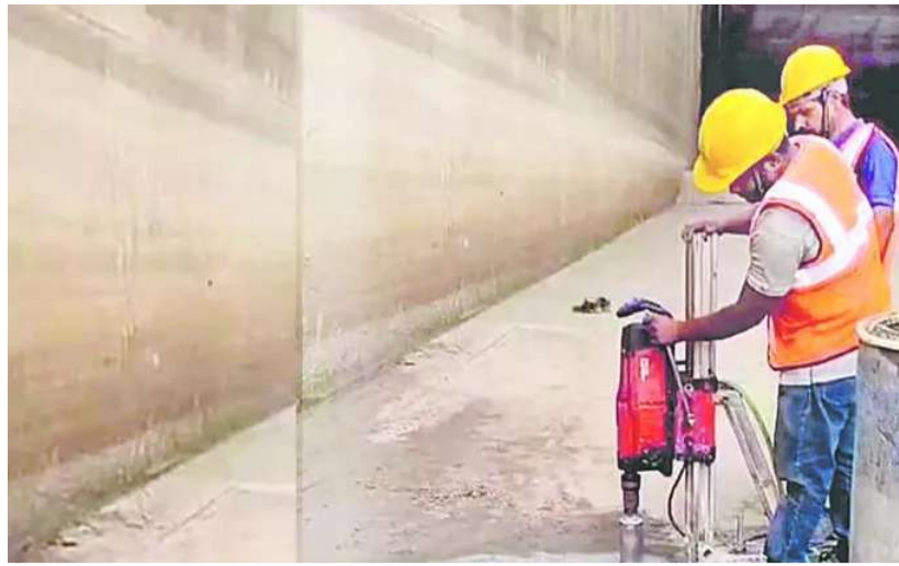
ఇటీవలి నివేదికలో పేర్కొంది. కుంగిన, పగుళ్లు ఏర్పడిన పియర్ల మధ్య ఉన్న గేట్లను కూడా జాగ్రత్తగా పైకి ఎత్తాలని సూచించింది. దీంతో ఈ నెల 15న గేట్లను ఎత్తారు. గురువారం 16వ నంబర్ గేట్లను ఎత్తడానికి ప్రయత్నించారు.. బ్యారే జీ కింది నుంచి భారీ శబ్దాలు, ప్రకంపనలు వచ్చాయి. దాంతో గేట్లు ఎత్తే ప్రయత్నాలను నిలిపేశారు.

గత ఏడాది అక్టోబర్ 21న ఏడో భాగ కుంగిన వెంటనే బ్యారేజీలోని 85 గేట్లకుగాను 77 గేట్లను ఎత్తి నీటిని వదిలేశారు. కుంగిన భాగంలోని 15వ నంబర్ నుంచి 22వ నంబర్ వరకు గేట్లు మొరాయిందాయి. వాటిని అలాగే వదిలేశారు. వానాకాలం వస్తుండటంతో నీటి ప్రవాహం మొత్తంగా కిందికి వెళ్లేలా.. అన్ని గేట్లను ఎత్తి ఉంచాలని ఎన్డీఎస్ఎస్ నిపుణుల కమిటీ