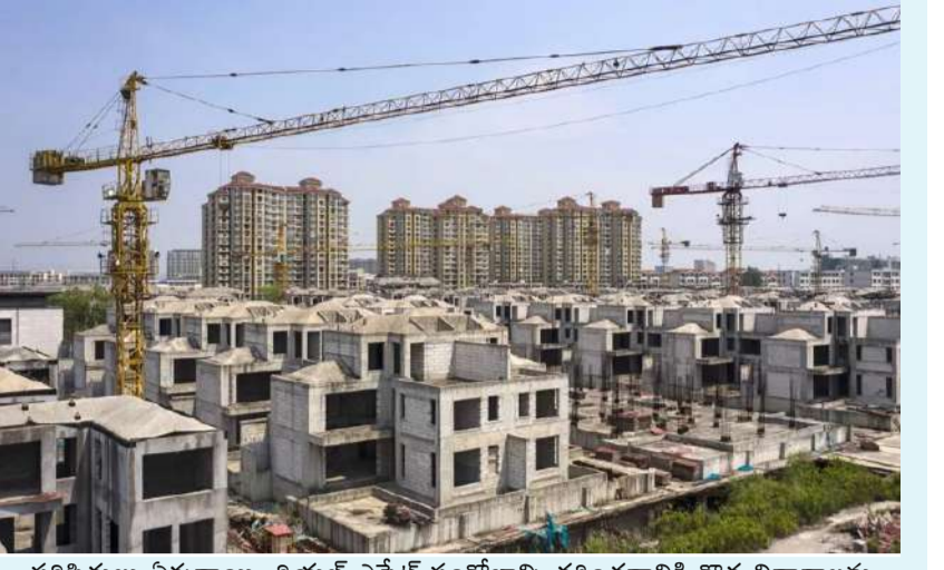
పరిస్థితులు ఏర్పడ్డాయి. రియల్ ఎస్టేట్ సంక్షోభాన్ని తగ్గించడానికి కొత్త విధానాలను అన్వేషిస్తామని ఏప్రిల్ 30న పాలక కమ్యూనిస్ట్ పార్టీ హామీ ఇచ్చిన తర్వాత పెట్టుబడిదారులు ప్రభుత్వ తదుపరి కదలికల కోసం ఎదురుచూస్తున్నారు.

రియల్ ఎస్టేట్ సంక్షోభాన్ని ఎదుర్కొంటున్న చైనా.. పరిస్థితిని గట్టికిందానికి కీలక ఆలోచన చేస్తోంది. దేశంలోని స్థానిక ప్రభుత్వాలతో కలిసి లక్షల కొద్దీ అమ్ముడుపోని ఇళ్లను కొనుగోలు చేయాలనే ప్రతిపాదనను పరిశీలిస్తోందని బ్లూమ్బర్గ్ నివేదించింది. ప్రాథమిక ప్రణాళికపై స్టేట్ కౌన్సిల్ పలు ప్రావిన్సులు, ప్రభుత్వ సంస్థల నుంచి అభిప్రాయాన్ని కోరుతోంది. రాష్ట్ర నిధుల సహాయంతో అదనపు హౌసింగ్ ఇన్వెంటరీని క్లియర్ చేయడానికి చైనా ఇప్పటికే అనేక పైలట్ ప్రోగ్రామ్లతో ప్రయోగాలు చేసింది. అమ్ముడుపోని ఇళ్లను ప్రభుత్వాల కొనుగోలు చేసే తాజా ప్రణాళికను అతిపెద్ద ప్రయత్నంగా భావిస్తున్నారు. ప్రణాళికలో భాగంగా కష్టాల్లో ఉన్న డెవలపర్ల నుంచి అమ్ముడుపోని ఇళ్లను అమ్మించేందుకు ప్రభుత్వ సంస్థలు సహాయం చేస్తాయి. బ్యాంకుల రుణాల ద్వారా భారీ తగ్గింపులతో ఆ ఇళ్లను కొనుగోలుదారులకు అందిస్తాయి. ప్రణాళిక, దాని సాధ్యసాధ్యాల వివరాలను అధికారులు ఇంకా చర్చిస్తున్నారు. చైనా ప్రభుత్వ పెద్దలు ఈ నిర్ణయంపై ముందుకు వెళ్లాలనుకుంటే అది ఖరారు కావడానికి కొన్ని నెలలు పట్టవచ్చని తెలుస్తోంది. అయితే దీనిపై చైనా గృహనిర్మాణ మంత్రిత్వ శాఖ అధికారికంగా స్పందించలేదు. ఈ ఏడాది మొదటి నాలుగు నెలల్లో చైనాలో గృహాల విక్రయాలు దాదాపు 47 శాతం క్షీణించాయి. అమ్ముడుపోని ఇళ్ల జాబితా ఎనిమిదేళ్ల గరిష్ట స్థాయికి చేరుకుంది. దీంతో ఈ రంగంలోని దాదాపు అర కోటి మంది నిరుద్యోగం బారినపడే ప్రమాదకర