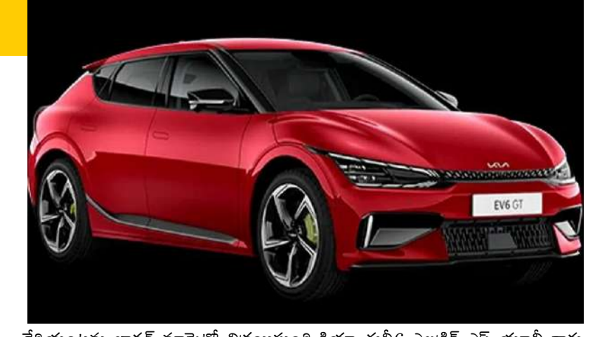
వేరియంట్లను భారత్ మార్కెట్లో విక్రయిస్తుంది.కియా ఈవీ6 ఎలక్ట్రిక్ ఎన్ యూవీ కారు ధర రూ.60.95 లక్షలతో ప్రారంభమై, టాప్ హై ఎండ్ వర్షన్ కారు ధర రూ.65.95 లక్షల పలుకుతుంది. కియా ఇండియా నుంచి వస్తున్న తొలి డెడికేటెడ్ ఈవీ మోడల్ 'ఈవీ6 ఎలక్ట్రిక్ ఎన్యూవీ' మొదటిది. ఈ-జీఎంపీ ప్లాట్ ఫామ్ బేస్డ్?గా ఈ కారు రూపుదిద్దుకున్నది.

దక్షిణ కొరియా ఆటో మేజర్ కియా ఇండియా తన 'ఈవీ6 ఫేస్లిఫ్ట్ (%జూఎ6 ట్యూవెన్టీఎట్)' ఎలక్ట్రిక్ ఎన్యూవీ కారును త్వరలో అప్ డేట్ చేసేందుకు రంగం సిద్ధం చేసింది. 2025 ఈవీ6 ఎన్యూవీ ఎలక్ట్రిక్ కారును గ్లోబల్ మార్కెట్లలో కొన్ని వారాల్లో ఆవిష్కరించనున్నది. ఈవీ6 ఎన్యూవీలో డ్రైవింగ్ రేంజ్ పెంచడానికి భారీ బ్యాటరీ ప్యాకేజీతోపాటు పలు ఫీచర్లు జత చేసినట్లు తెలుస్తున్నది. ఫ్రంట్, రేర్ పై కంపెనీ కారు మోడల్ ప్యాకేజీ వివరాలు ఉంటాయని తెలుస్తున్నది. హెడ్ లైట్, టెయిల్ లైట్ కొత్తగా అప్ డేట్ చేశారు. కొత్తగా 'స్టార్ మ్యాప్ సిగ్నల్ రిక్లింగ్'తోపాటు హెడ్ లైట్ యూనిట్ చుట్టూ రామ్ ఆరోండ్ ఎలిమెంట్తోపాటు ఎల్ఈడి డే లైం రన్యింగ్ లైట్స్ ఉంటాయి. ప్రస్తుత ఈవీ6 కారులో కంటే తక్కువ కెపాసిటీ గల ఎల్ఈడి హెడ్ లైట్ ఉంటుంది. బంపర్, గ్రీల్ డిజైన్లోనూ మార్పులు ఉంటాయని తెలుస్తున్నది. రీఫ్రెష్డ్ డిజైన్తోపాటు కనెక్టెడ్ ఎల్ఈడి టెయిల్ లైట్స్, ఈవీ ఎండ్ యాల్ సిగ్నల్, ఫ్రెష్ డిజైన్తో రేర్లో బంపర్, రీ డిజైన్డ్ అల్ట్రావీల్స్ వస్తున్నాయి. రీడిజైన్డ్ స్టీరింగ్ వీల్, న్యూ ఇన్ఫోటైమ్మెంట్ డ్రీవ్, మున్సి సీట్స్, కంఫర్ట్ ఫీచర్లు ఉంటాయి. ఇంకా కియా ఈవీ6 ఫేస్లిఫ్ట్ ఎలక్ట్రిక్ ఎన్యూవీ కారులో ఇంతకుముందు హ్యూండాయ్ ఐయానిక్ 5లో వినియోగించిన 84కిలోవాట్ల బ్యాటరీ ప్యాకేజీ వాడతారని తెలుస్తుంది. సింగిల్ ఛార్జింగ్తో 700కి.మీ పై విలుకు దూరం ప్రయాణించే కెపాసిటీ గల జీటీ లైన్, జీటీ లైన్ ఏడబ్ల్యూడి