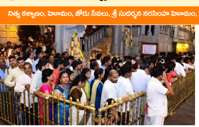
యాదాద్రి వార్తా మిర్చి ప్రతినిధి : తెలంగాణలోని ప్రసిద్ధ ఆధ్యాత్మిక శ్రేష్టమైన యాదాద్రి లక్ష్మీనరసింహస్వామి ఆలయంలో భక్తులకు ఇకనుంచి డ్రెస్ కోడ్ తప్పనిసరి కానుంది. నరసింహస్వామి దర్శనానికి వచ్చే భక్తులు సంప్రదాయ దుస్తులు ధరించాలని యాదగిరిగుట్ట దేవస్థానం నిర్ణయించింది. వివిధ సేవల్లో పాల్గొనే భక్తులు తప్పనిసరిగా సంప్రదాయ దుస్తులు ధరించే నియమం జూన్ 1 నుంచి అమల్లోకి రానుంది.యాదాద్రి ఆలయ పునర్నిర్మాణం తర్వాత లక్ష్మీనరసింహస్వామిని దర్శించుకునే భక్తుల సంఖ్య పెరుగుతోంది. ఆలయంలో ఇప్పటికే ఆలయ ఈవోతోపాటు సిబ్బంది కూడా డ్రెస్ కోడ్ను పాటిస్తున్నారు. హిందూ సంప్రదాయాన్ని ప్రతిబింబించేలా భక్తులు సంప్రదాయ దుస్తులు ధరించేలా చర్యలు చేపట్టాలని యాదగిరిగుట్ట దేవస్థానం నిర్ణయించింది. నిత్య కళ్యాణం, హోమం, జోడు సేవలు, శ్రీసుందర్వన నారసింహ హోమం, శ్రీసత్యనారాయణ స్వామి వ్రతాల తదితర ఆర్థిక సేవల్లో పాల్గొనే భక్తులు సంప్రదాయ దుస్తులు ధరించేలా నియమాన్ని అమలు చేయనుంది.తిరుమల