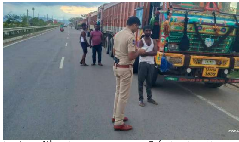
ములుగు జిల్లా పోలీసు యంత్రాంగం మొత్తాన్ని హై అలెర్ట్ చేశారు. ఈ సందర్భంగా జిల్లా ఎస్పీ మాట్లాడుతూ:- ఇకపై జిల్లా మొత్తంలో డ్రంక్ అండ్ డ్రైవ్ తనిఖీలు ముఖ్యంగా ఇసుక లాల్లీలను ప్రతి పోలీస్ స్టేషన్ పరిధిలో తనిఖీలు చేయడం జరుగుతుందని ఎవరైనా ఇసుక లాల్లీలను రోడ్డుకు ఇరువైపులా అనుమతి లేకుండా ఆపిన చట్ట విరుద్ధంగా ఇసుక రవాణా చేసిన రోడ్డు నియమాలను పాటించకుండా అతివేగంతో ప్రయాణించిన ఉపేక్షించేది లేదని వారి పైన చట్ట ప్రకారం కఠినమైన కేసులు నమోదు చేస్తామని జిల్లా ఎస్పీ తెలియజేయడం జరిగింది.