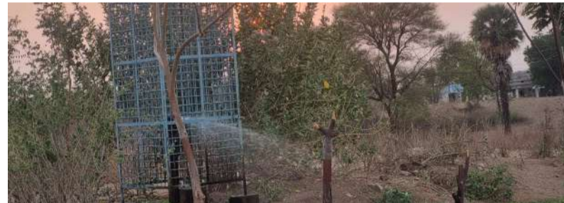
ఎదుర్కొంటున్నవని, అలాంటి సమయంలో మిషన్ భగీరథ నీటిని వృధాగా పోతున్న అధికారుల పట్టించుకోవడం పట్ల అసహనం వ్యక్తం చేస్తున్న ప్రజలు.ఇప్పటికైనా మిషన్ భగీరథ అధికారులు పైవే లైన్ మరమ్మత్తు చేసి నీటిని వృధాగా పోకుండా చేయాలని, నీరు అందని గ్రామాలకు నీరు అందించా చర్యలు తీసుకోవాలని వేడుకుంటున్నారు...