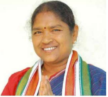
ములుగు జిల్లాను తరలించడం పూర్తి దుష్ప్రచారం అని రాష్ట్ర పంచాయతీరాజ్, గ్రామీణ అభివృద్ధి, స్త్రీ శిశు సంక్షేమ శాఖ మంత్రి డాక్టర్ ధనసరి అనసూయ సీతక్క అన్నారు.

ములుగు, ఏప్రిల్ 30, వార్త మిర్రర్, ఎన్నో పోరాటాల ద్వారా సాధించుకున్న ములుగు జిల్లాను ఎక్కడికి పోనిచ్చేది లేదని ములుగు జిల్లా తరలిపోతుందంటూ విపక్షాలు చేస్తున్న ప్రచారం అది దుష్ప్రచారం అని రాష్ట్ర పంచాయతీరాజ్, గ్రామీణ అభివృద్ధి, స్త్రీ శిశు సంక్షేమ శాఖ మంత్రి డాక్టర్ ధనసరి అనసూయ సీతక్క అన్నారు. ములుగు జిల్లా కేంద్రంలో ఆరోజు సభ్యుల వర్గాల ప్రజలు... స్థానిక జర్నలిస్టులు... ఏకమై ములుగు జిల్లా ఏర్పాటు కోసం పోరాటాలు చేసి సాధించుకున్నాం అని ఈ జిల్లా పోతుంది అని ప్రతి పక్షాలు ప్రజలను అయోమయానికి గురిచేస్తున్నారని అని ప్రజలు వాళ్ళు చెప్పే మాటలను నమ్మద్దు అని ఆమె అన్నారు. గత ప్రభుత్వం ములుగు జిల్లా జీవో జారీ చేసినప్పటికీ నూతన ప్రభుత్వంగా ఏర్పడిన కాంగ్రెస్ ప్రభుత్వం హయాంలో ములుగు జిల్లాకు కావలసిన విధులను నిధులను కేటాయిస్తూ నూతనంగా ఏర్పడిన మల్లంపల్లి మండలం లో అభివృద్ధి కార్యక్రమాలు చేసుకుందాం అని కాంగ్రెస్ పార్టీ అధికారంలోకి రాగానే ములుగు జిల్లాను తరలిస్తున్నారని ప్రతిపక్ష పార్టీలు దృశ్యప్రచారం చేస్తున్నారని. నాడు జిల్లా సాధన కోసం పోరాడిన క్రమంలో స్థానిక శాసన సభ్యులూ గతం నుంచి కూడా జిల్లా ఏర్పాటుకు ఎనలేని కృషి పోరాటాలు చేయడం జరిగిందన్నారు కాంగ్రెస్ పార్టీ ఏ రోజు కూడా ములుగు