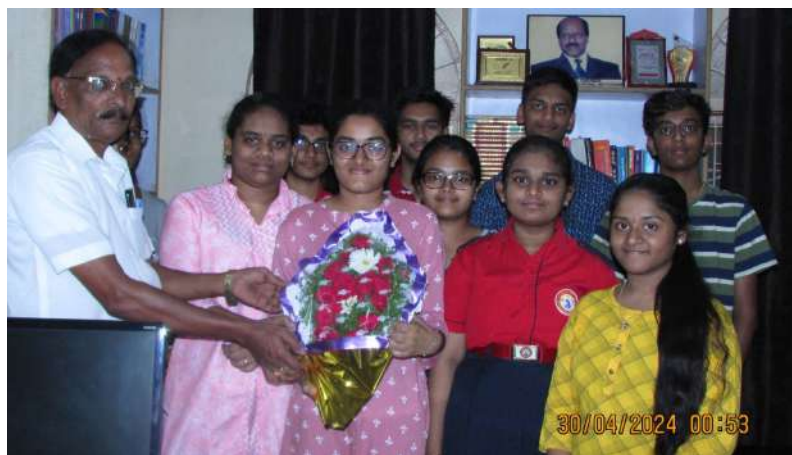
పదవ తరగతి పరీక్ష ఫలితాలలో