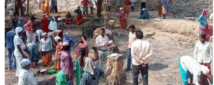
కార్యక్రమంలో ఆయా గ్రామ పంచాయతీల పంచాయతీ కార్యదర్శులు, ఐకెపి సీసీ పరిపూర్ణ చారి, సంబంధిత విఓ లీదర్లు పాల్గొన్నారు.