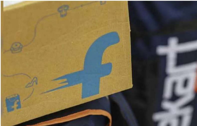
లక్ష్యంగా పెట్టుకుంది. అయితే అదే రోజు డెలివరీ పొందాలంటే కస్టమర్లు మధ్యాహ్నం ఒంటి గంటలోపే వస్తువులను ఐక్ చేసుకోవాల్సి ఉంటుంది. ఇలా చేస్తే ఆ రోజు ఆర్డరాన్ని 12 గంటలలోపు వస్తువులు డెలివరీ చేస్తారు. ఒకవేళ మధ్యాహ్నం ఒంటి గంట తర్వాత ఐక్ చేసినట్లయితే మరుసటి రోజు డెలివరీ అవుతాయి. మరిన్ని బిజినెస్ వార్తల కోసం క్లిక్ చేయండి..