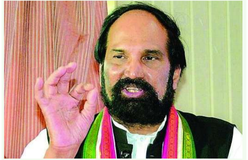
రెండేళ్లలోగా పూర్తి చేయాలి ఎన్ఎల్బీసీ, డిండి ప్రాజెక్టులపై అధికారులకు మంత్రి ఉత్తమ ఆదేశం