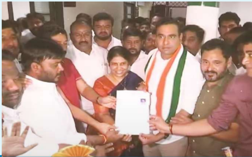
భువనగిరి ఎంపీ అభ్యర్థిగా

సంపుటి : 10 సంచిక : 14 రంగారెడ్డి ఎడిటర్ బి. శ్రీధర్ యాదవ్ పేజీలు 8 వెల 4/-