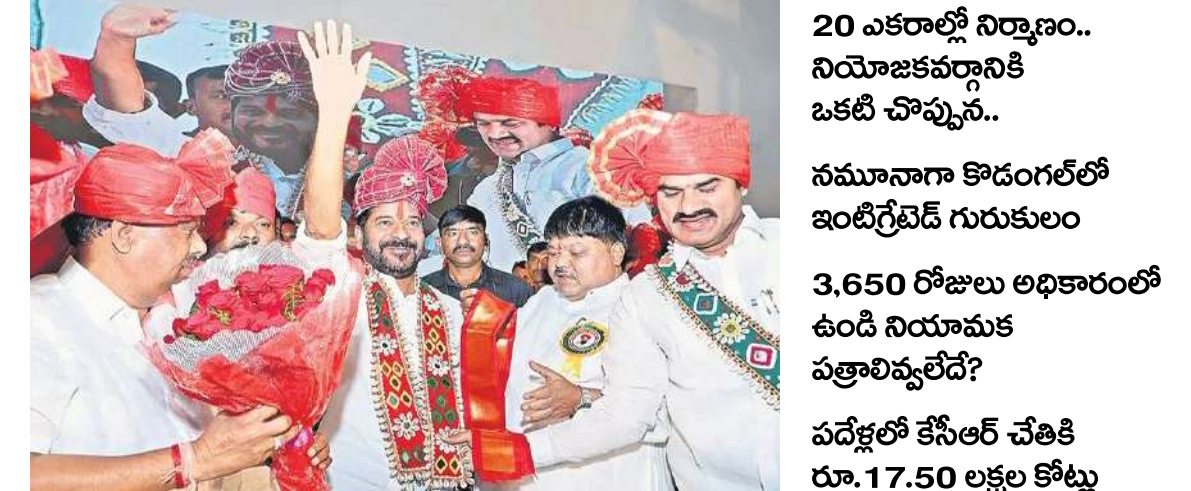
(మగతా 2వ పేజీలో)

20 ఎకరాల్లో నిర్మాణం.. నియోజకవర్గానికి ఒకటి చొప్పున.. నమూనాగా కొడంగల్లో ఇంటిగ్రేటెడ్ గురుకులం 3,650 రోజులు అధికారంలో ఉండి నియామక పత్రాలివ్వలేదే? పదేళ్లలో కేసీఆర్ చేతికి రూ. 17.50 లక్షల కోట్లు