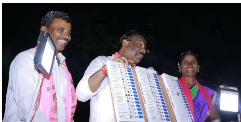
వ్యాప్తంగా అభివృద్ధి చేశామని ఈ సందర్భంగా పేర్కొన్నారు....