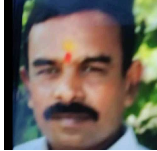
లారీ డ్రైవర్ నిర్లక్ష్మం హోంగార్లు మృతి