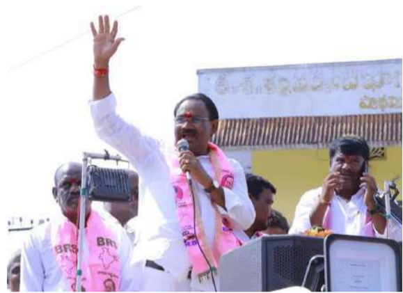
(వార్త మిర్చర్ ప్రత్యేక ప్రతినిధి)