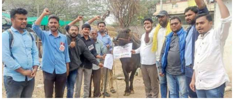
సమీక్ష సమావేశం కూడా జరపలేదని, మొద్దు నిద్రలో పయనిస్తున్న రాష్ట్ర ప్రభుత్వానికి కనువింపు కలగాలని దున్నపోతుకు వినతి కార్యక్రమాన్ని ఏర్పాటు చేశామని వారు అన్నారు. ఎన్టీఆర్ కార్యక్రమం సాధించాలనే అభ్యర్థులకు తీవ్ర అన్యాయం జరిగిందని వారు అన్నారు. డీఎస్ఎస్ఐ/ఆర్టీ బోర్డ్ చైర్మన్ ఏకపక్ష నిర్ణయాలతోనే అభ్యర్థులకు నష్టం జరుగుతుందని, చైర్మన్ ను తొలగించాలని వారు డిమాండ్ చేశారు. ఈ నెల 9వ తేదీన ఛలో హైదరాబాద్ కార్యక్రమం నిర్వహించనున్నామని, ఈ కార్యక్రమానికి రాష్ట్ర నలుమూలల నుంచి ఎస్ఐ, కానిస్టేబుల్ అభ్యర్థుల హాజరుకావాలని వారు పిలుపునిచ్చారు.