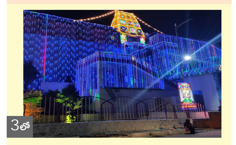
భద్రాబ్రికి ముక్కోటి పర్వదిన శోభ

పజల సహకారంతో మరింత ముందుకు అభికారులు నిర్దేశిత లక్ష్యం చేరుకోవాలి న్యూ ఇయర్ విషెస్ చెప్పిన మంత్రి ఎర్రబెల్లి